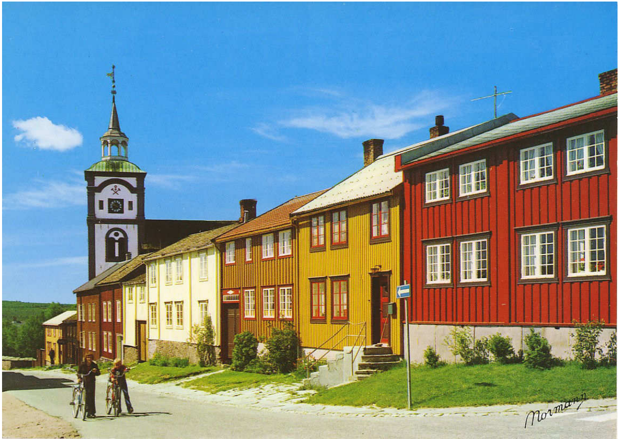
Figur 10. Udatert. Etter samtidige beskrivelser må dette bildet være tatt i begynnelsen av 1980 – årene.

Fargegjengivelsene på postkortene er ikke korrekt, og kan skape problemer hvis vi ønsker å bruke dem som nøyaktig kilde. Hvis vi sammenlikner de funnene som er gjort ved fargeundersøkelsene, (se fig. 11 – fig. 13.) med fargene som gjengis på postkortene, ser vi at det til dels er store avvik. Dette er ikke uvanlig for fargegjengivelsene på fargetrykte postkort fra perioden ca. 1950 – ca. 1990.