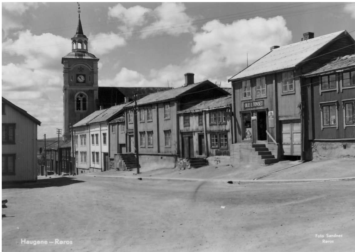
Figur 5. Udatert. Ingen endringer. Bildet trolig tatt like etter fig 4. Jon Brønnes postkortsamling.