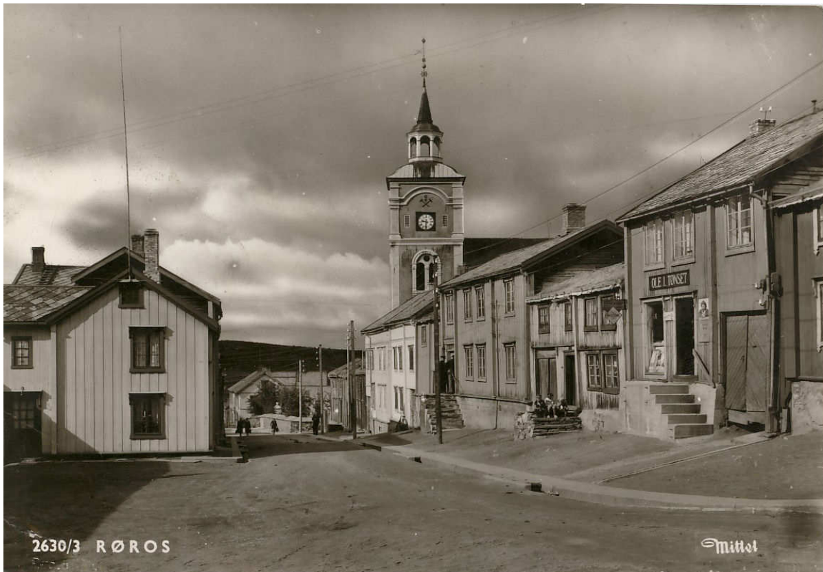
Figur 3. Datert 18.8.1955. Huset står fremdeles i samme utførelse som da Sohlberg malte sitt bilde. Det ser ut til at panelet på nr. 54, er malt mørkere enn tidligere.