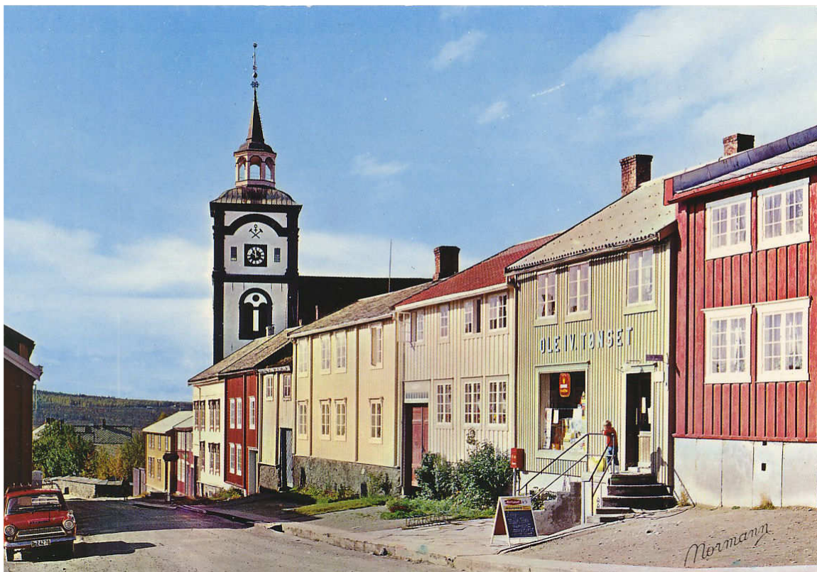
Figur 9. Udatert. Trolig tatt noen få år etter fig. 8., i slutten av 1960-åra.