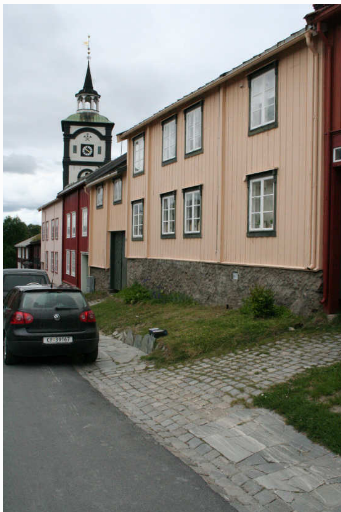
Kjerkgata 54. 29.6.2007.