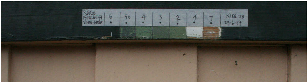
Figur 13. Farge-trapp avdekket på vindusgerikt. 29.6.2007.