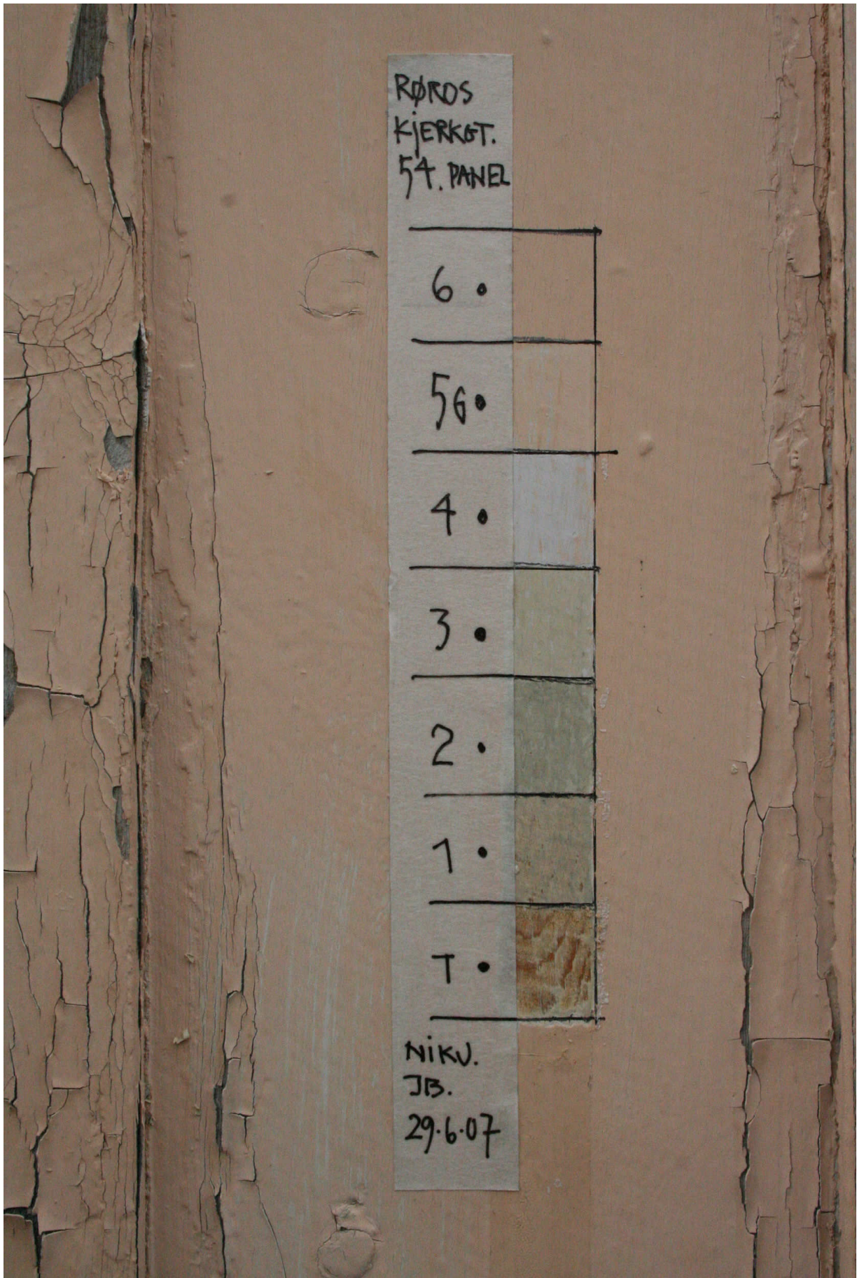
Figur 11. Fargetrapp avdekket på panelet. 29.6.2007.