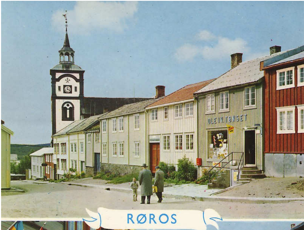
Figur 8. Udatert. Trolig ca. 1965. Porten ser ut til å være blågrå, en farge som ikke ble funnet ved fargeundersøkelsen. Jon Brønnes postkortsamling.