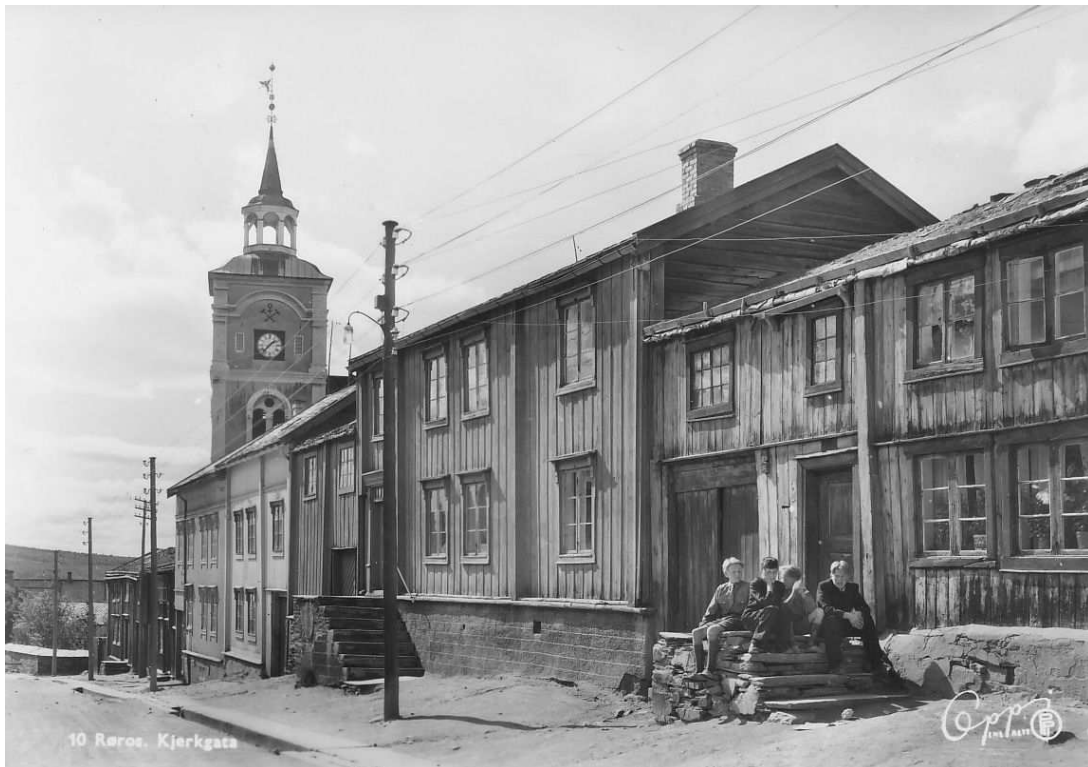
Figur 6. Udatert. Trolig siste del av 1950- åra, rett før ombyggingen. Vinduene i portloftet til venstre for hoveddøra, er av samme type som i hovedbygningen. Huset er malt etter det utseendet fasaden hadde på fig 5.