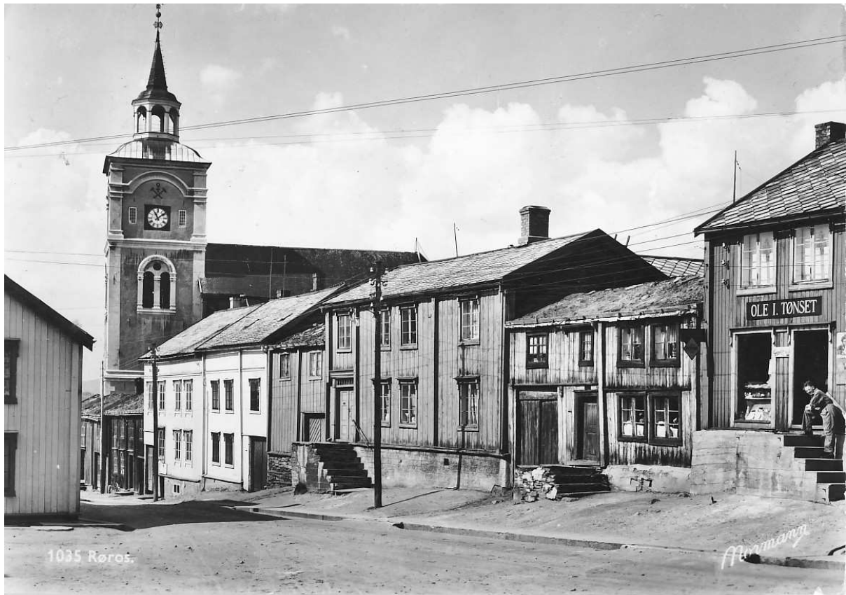
Figur 4. Datert 7.8.1959. Det ser ikke ut til at huset er behandlet etter det som vises på fig 3. Jon Brønnes postkortsamling.