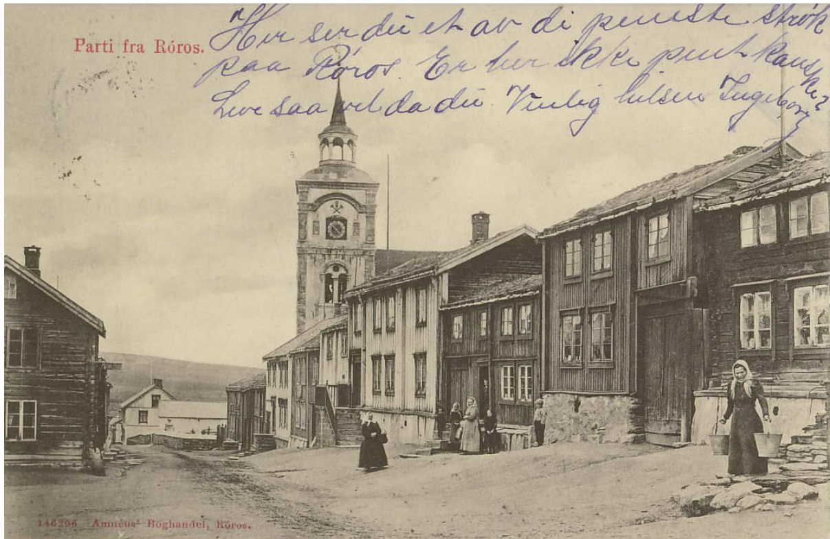
Figur 2. Datert 19.2.1913. Nr. 54 er huset bak kona til venstre. Trappa og inngangsdøra vises tydelig. Det kan være en lys farge huset har, tilsvarende fig. 1.