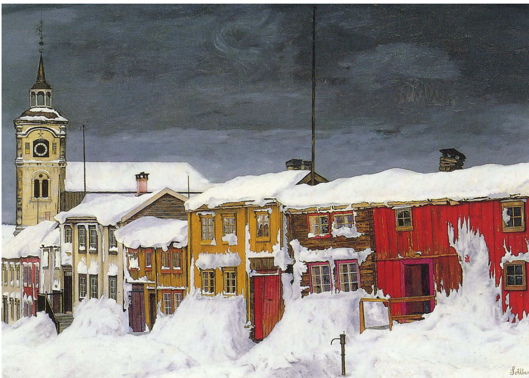
Figur 1. Datert 1903. Maleren Harald Sohlbergs kjente bilde. Kjerkgata 54 er det hvite huset med grå gerikter.

I 1982 var huset malt med hvit panel og vinduer, og grønne vindusgerikter og port.