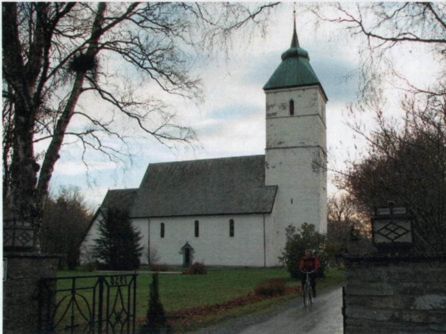
Fig. 2. Værnes kirke sett fra nordvest.