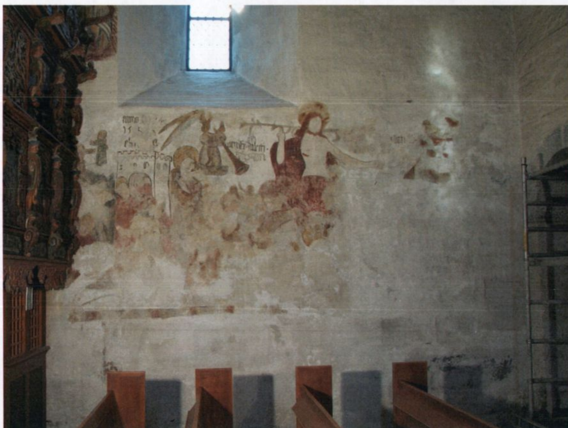
Fig. 3. Kalkmalt dommedagsfremstilling, nordvegg skip.

Hovedprosjektet består av rensing, fjerning og utbedring av en del tidligere reparasjoner, kantsikring og utfylling av skader. Avslutningsvis ble nye og eldre utbedrede reparasjoner retusjert i form av tilpassing til det originale kalkmaleriets grunnfarger.