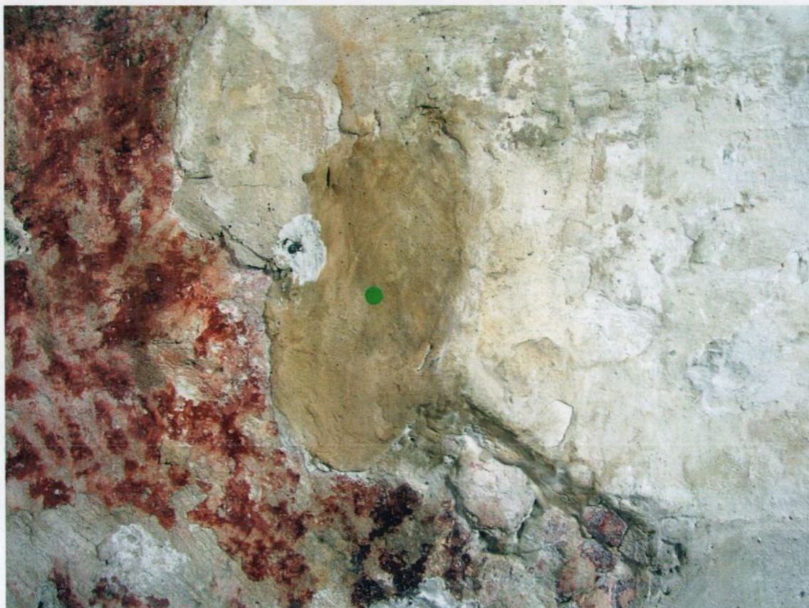
Fig. 6 Tidligere utført gipsbasert reparasjon som i dag har gulnet.

skåret i nivå med det omgivende originale materialet, og senere kalket og eventuelt retusjert. Enkelte andre reparasjoner ble kun overkalket, eventuelt overkalket og retusjert. (Se fig.7)