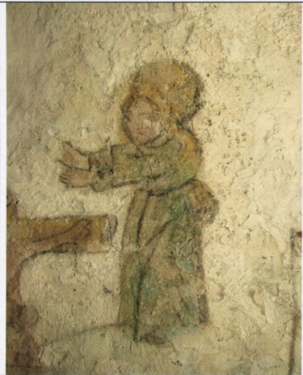
Fig. 12. Etter retusjering