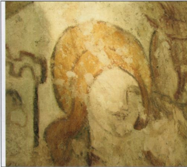
Fig. 8. Før retusjering