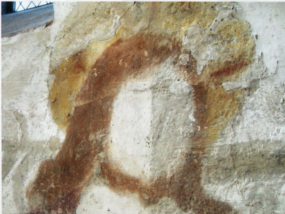
Fig. 5. Kristus' hode delvis rensset.

Pigmentenes avbinding til kalkmediet ble testet. Fargelaget var relativt godt avbundet. Overflatene var skitne, men skitten hadde kun i liten grad gått inn i overflatene. En tørrensende rengjøringsmetode ved hjelp av svamp ble derfor valgt. Den benyttede svampen er Wishab, som er en syntetisk svamp. Metoden er skånsom fordi svampen løses opp ved friksjon, og tar dermed bort løstsittende sot og fett i overflaten. Etter rensing med svamp ble hele området børstet med en myk pensel. (Se fig. 5)