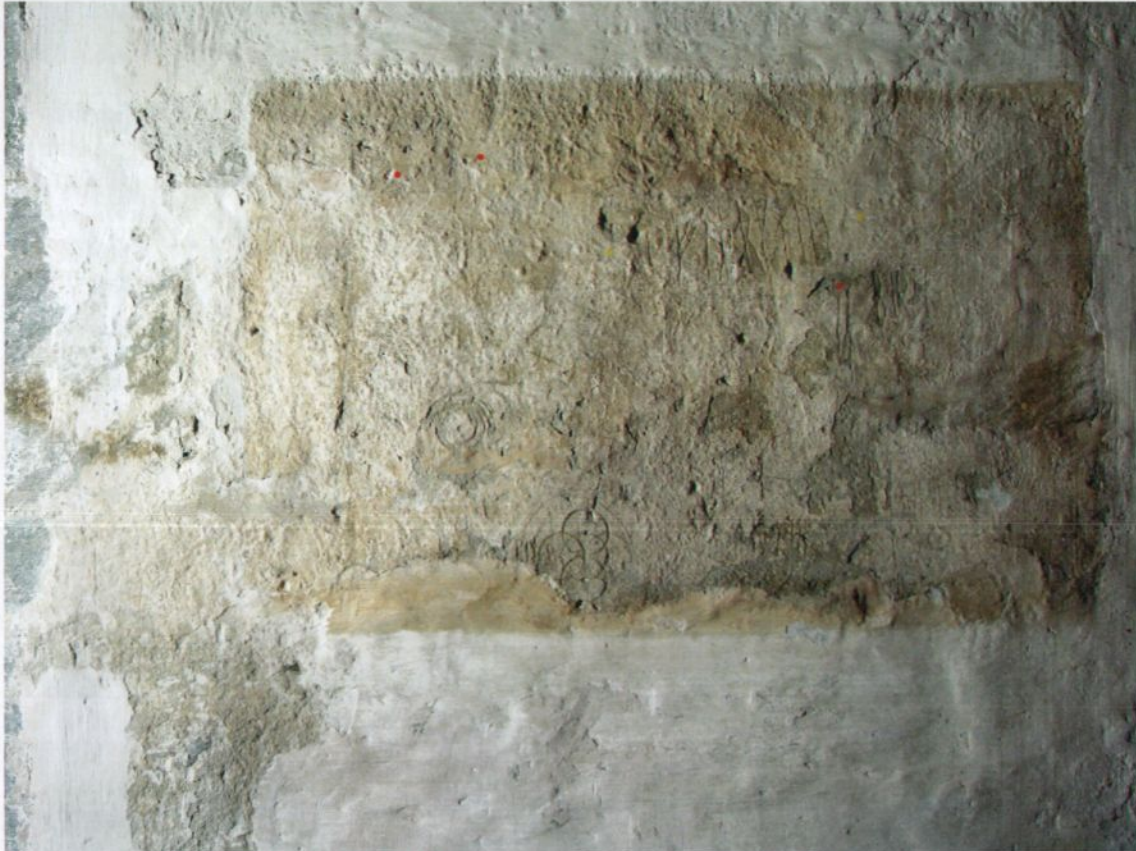
Fig. 4. Runefelt, Korets sydvegg. (Små røde prikker er markering for skader registrert under konserveringsarbeidet, november 2008)

Et nyere draperi dateres til etter 1740 10 . Dette er en enkel strekdekor som befinner seg inne i korets sydlige vindu som fikk sin nåværende utvidelse på 1740-tallet.