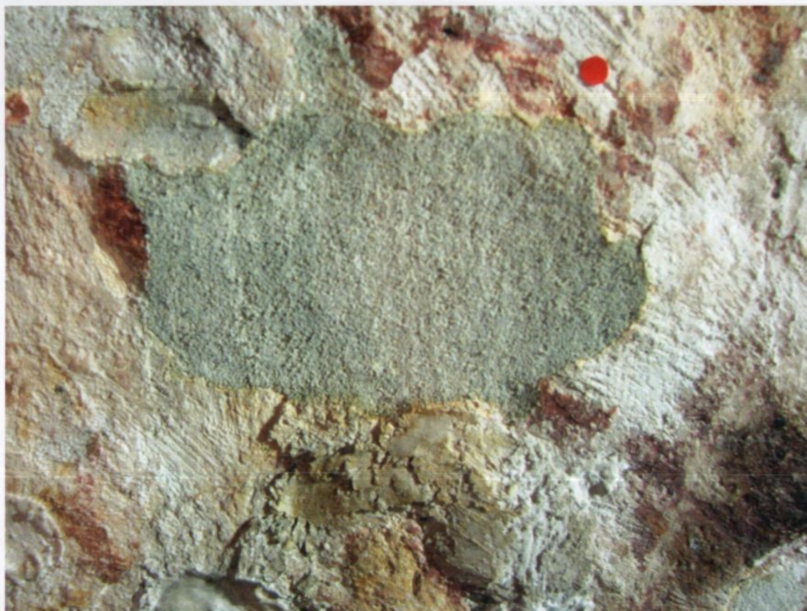
Fig. 7. Reparasjonspuss før kalking og retusjering. Pussen er her skåret ned for å flukte med det omkringliggende vegglivet. (Rød prikk er fra skaderegistreringen. Som viser at det her var behov for kantsikring og ifylling).