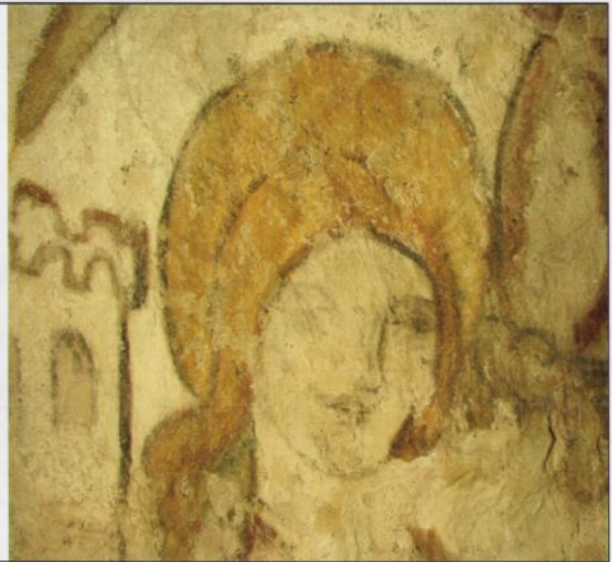
Fig. 9. Etter retusjering