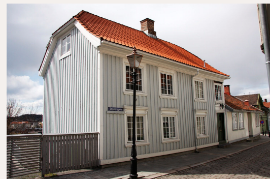
Snipetorggata 20 er eit tidstypisk borgarhus i tre i gate-miljøet som slapp unna bybrannen i Skien i 1886, og er ein av fem eigedomar på Snipetorp i Skien freda ved felles vedtak i 1954.