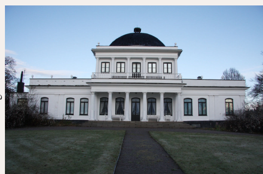
Hovudbygningen på Ulefoss hovedgård i Nome av arkitekt Jørgen Henrik Ravert er rekna som det viktigaste arkitektoniske verket frå empiretida i Noreg.