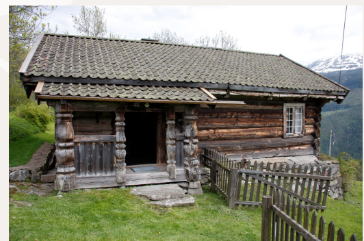
Stovebygning på Øvrebø søndre vestre i Hjarptal er eit døme på den typiske einhøgdes, upanelte stova.