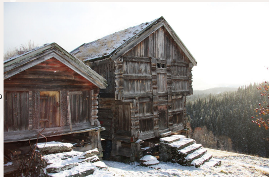
Loft og bur på Djuvland søndre i Vinje. På Djuvland er det òg freda ein stovebygning.