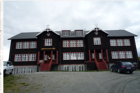
Strand internat i Sør-Varanger var det første statsinternatet i Norge – ett ledd i den norske stats fornorskingspolitikk overfor samer og finnlendere/kvener.