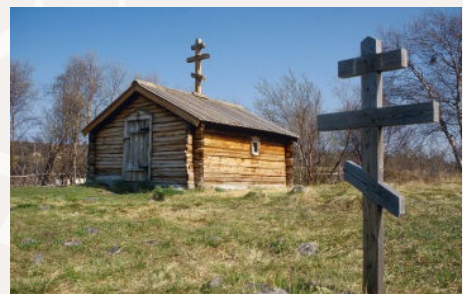
St Georgs kapell i Skoltebyen, Neiden er Norges minste sakrale bygning.