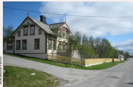
Esbensengården på Bakken i Vadsø i sveitserstil er eksempel på borgerstandens bygninger.