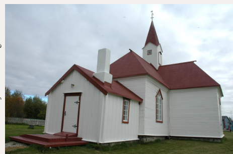
Karasjok gamle kirke, Finnmarks eldste stående kirkebygning, fra 1807.