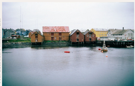
Brodtkorbsjøene i Vardø viser innslag av russisk byggeskikk.