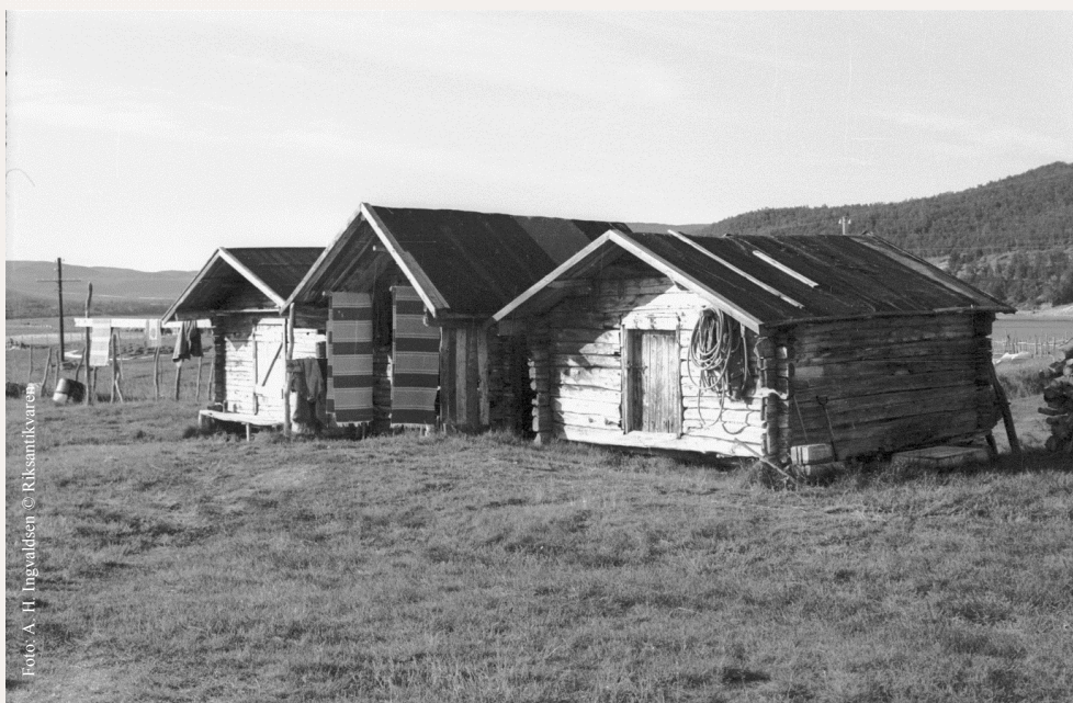
Samiske stabbur på Påljorden i Tana.

I de senere årene er det fredet flere ulike bygninger og anlegg i Finnmark. I 1998 ble det på bakgrunn av nasjonal verneplan for fyrstasjoner fredet en rekke fyrstasjoner i Norge. Flere av disse ligger i Finnmark. Ett eksempel er Kjølnes fyrstasjon i Berlevåg som omfatter fyr med bifyr, to boliger, to uthus, maskinhus og naust.