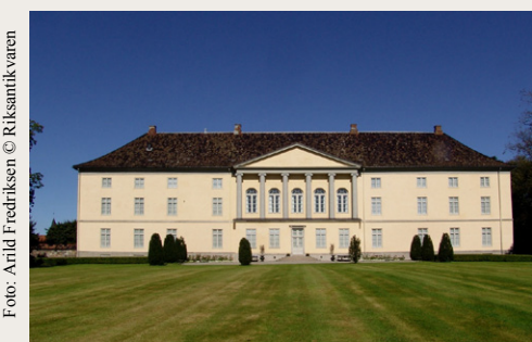
Jarlsberg Hovedgård i Tønsberg er eksempel på overklassens storslåtte hovedbygninger

De første fredningene dokumenterte historien langs kysten. Dette er bygninger knyttet til følgende epoker og sosial status: