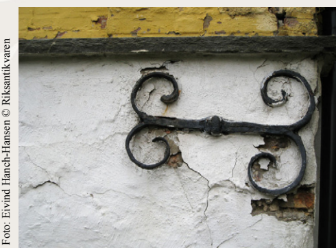
Detalj fra Den gamle tollbod i Larvik. Bygningen er restaurert i 2010- 2012.

Da Lov um bygningsfredning trådte i kraft i 1921, ble Den antikvariske bygningsnemnd oppnevnt av departementet. Det var lovfestet at nemnda skulle bestå av fem menn, hvorav riksantikvaren var den ene. Av de øvrige medlemmene skulle én være arkitekt, én jurist og én bygningskyndig. Nemnda besto inntil bygningsfredningsloven ble erstattet av kulturminneloven i 1978.