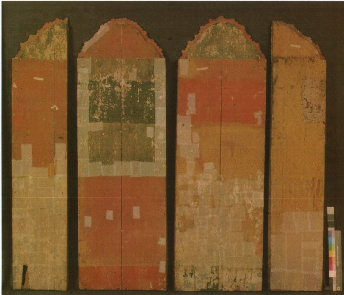
Fig 1: Skapet, bakside, uten bakvegg. Foto: Birger Lindstad, desember 2005