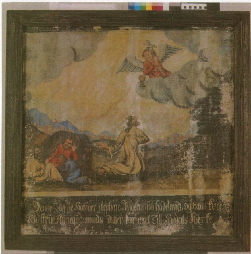
Fig. 1: "Jesus i Getsemane". Foto: Birger Lindstad, desember 2005. Før behandling