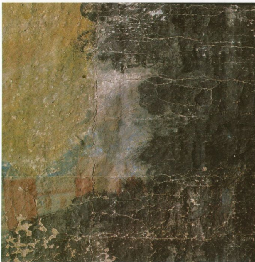
Fig. 3: "Jesus i Getsemane", Detail. Foto: Birger L. Lindstad, desember 2005. Før behandling

Fernissen har ujevn i glans, og er særlig blank langs kantene av vannskjolder.