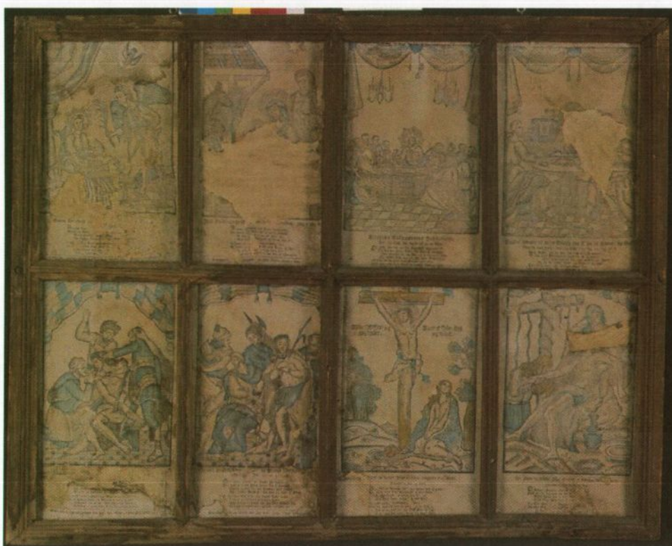
Fig 1: Tresnitt med ramme. Foto B.Lindstad des 2005, før behandling