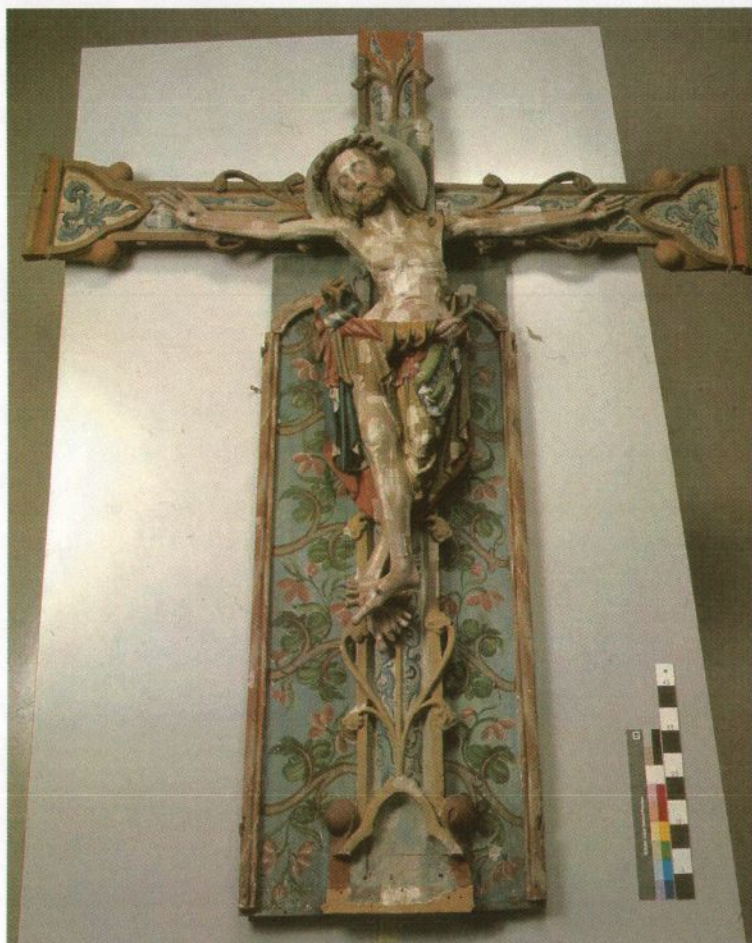
Fig. 1. Krusifikset i Hedalen stavkirke. Foto: Birger Lindstad, november 2005