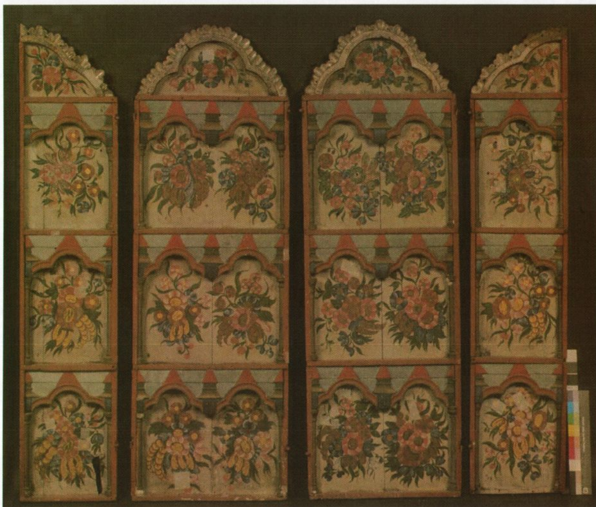
Fig 1: Skapet, innside, uten bakvegg. Foto: Birger Lindstad, desember 2005