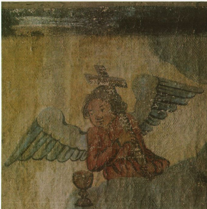
Fig. 2: "Jesus i Getsemane", Detail. Foto: Birger L. Lindstad, desember 2005. Før behandling