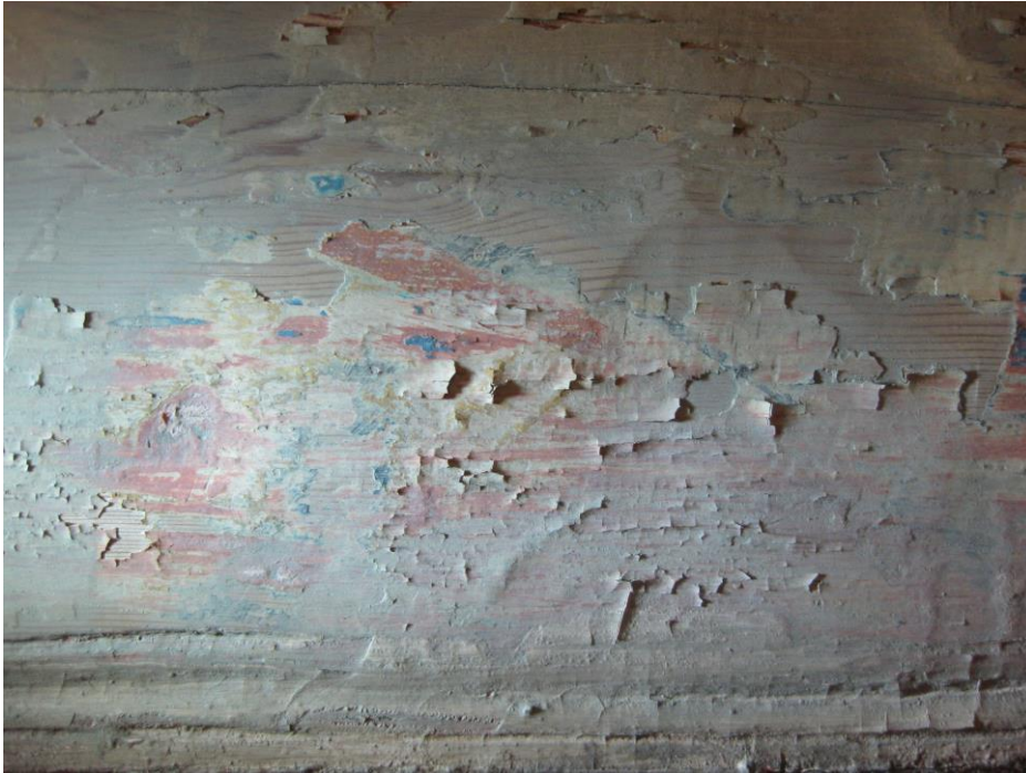
Fig 12. Detalj, før flatekonsolidering.