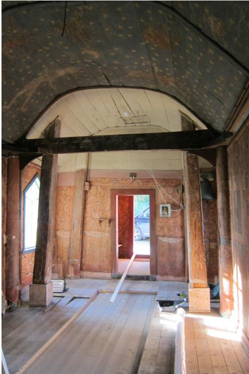
Fig.3. Foto, tatt i forbindelse med sikringsarbeid i 2011 8 , skipet mot vest. Her kan man tydelig se at det er en forskjell mellom den eldste delen i øst, og den nyere delen av skipet, mot vest. Den delen av skipet som har hvit himling, er en påbygning fra begynnelsen av 1700-tallet.