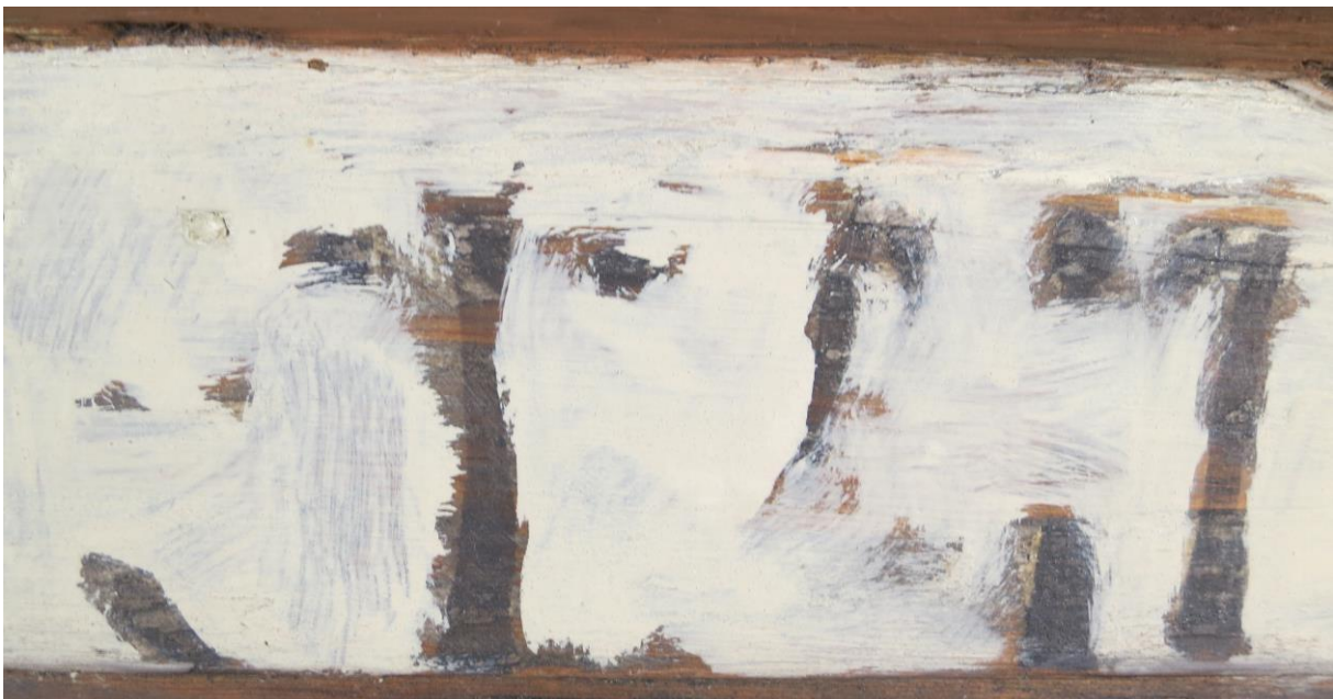
Fig. 4 Detalj av skriftfelt på nordveggen. Det er svært omfattende retusjert, og det som er igjen av den originale skriften er svært vanskelig å tolke.

Tekstfeltet i korbuen er annerledes behandlet enn på de andre veggene. Her er det mer original tekst igjen, og den har også vært mye mer forsiktig retusjert. Malingens overflate viser ikke de samme