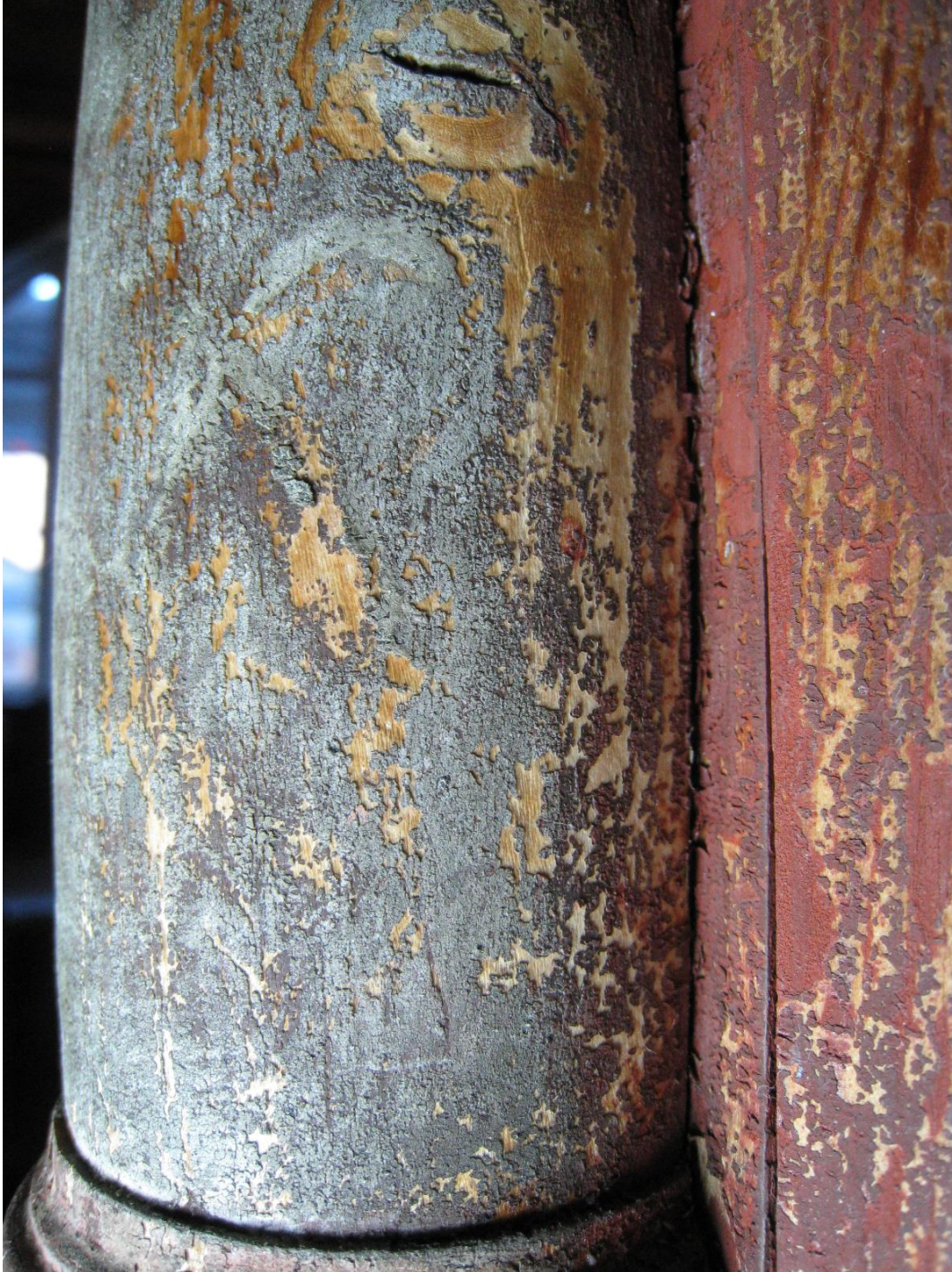
Fig. 11. Detaljfoto, midtre søyle, prekestolen. Før behandling

Det var en del utfall og små harde oppskallinger på søylene. Mindre utfall i tilknytning til omrammingene rundt billedfeltene. Bokstaven «o» i «Anno» manglet. Flatene var overstrøket med kokt linolje, og noen deler av stafferingene er brukket av.