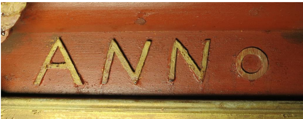
Fig 14, 15 og 16, før under og etter behandling