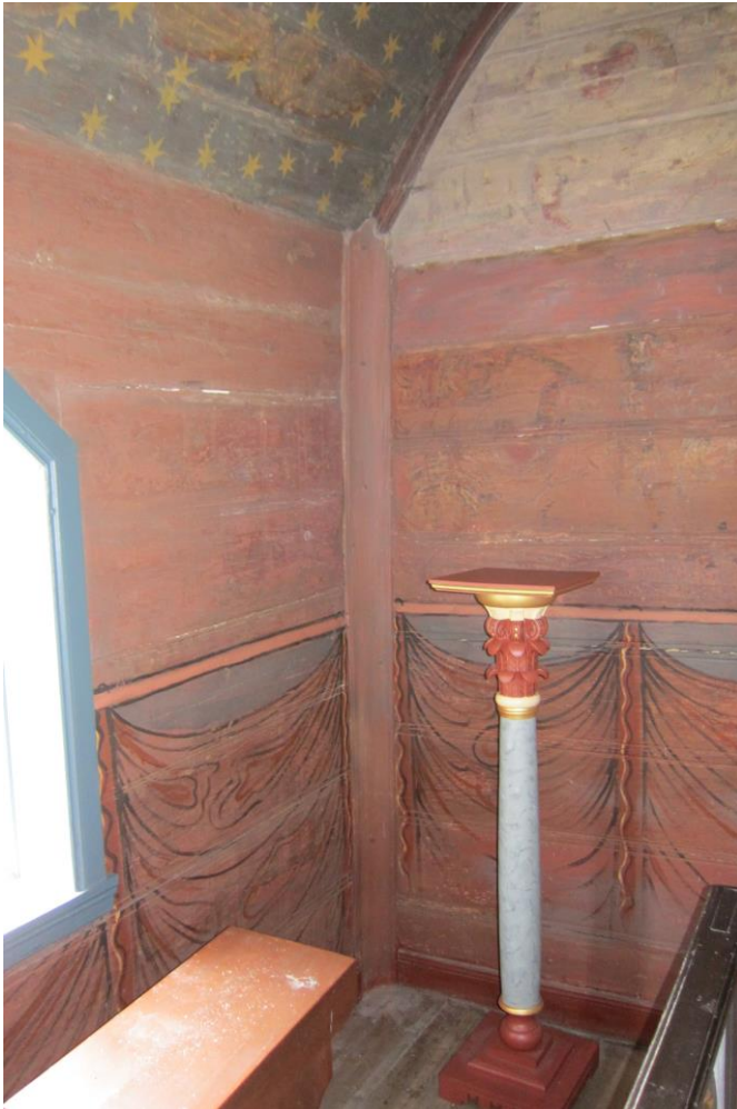
Fig. 1: Korets nordøstre hjørne. Man kan skimte rester av dekor under tynne rosa og gråhvite malinglag. Himlingen er også sterkt overmalt.

Korets vegger er overmalt med et tynt lag rosa maling, og den øverste del av østveggen har et tynt gråhvitt lag maling. Man kan likevel skimte figurer og tekst, sentrert i midten av veggen. Himlingen i kor og skip er blåmalt med stjerner, engler og andre figurer.