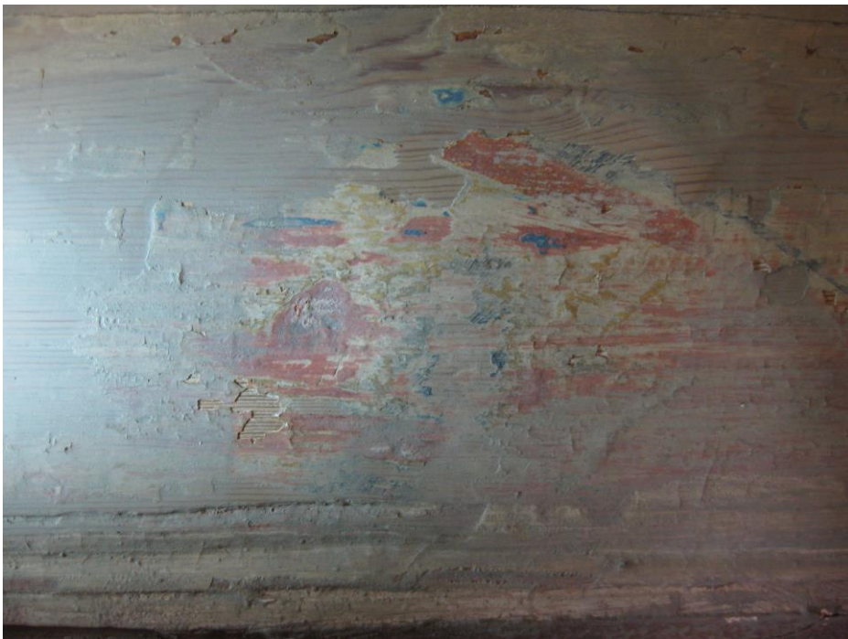
Fig.13: Samme område som over, etter flatekonsolidering.