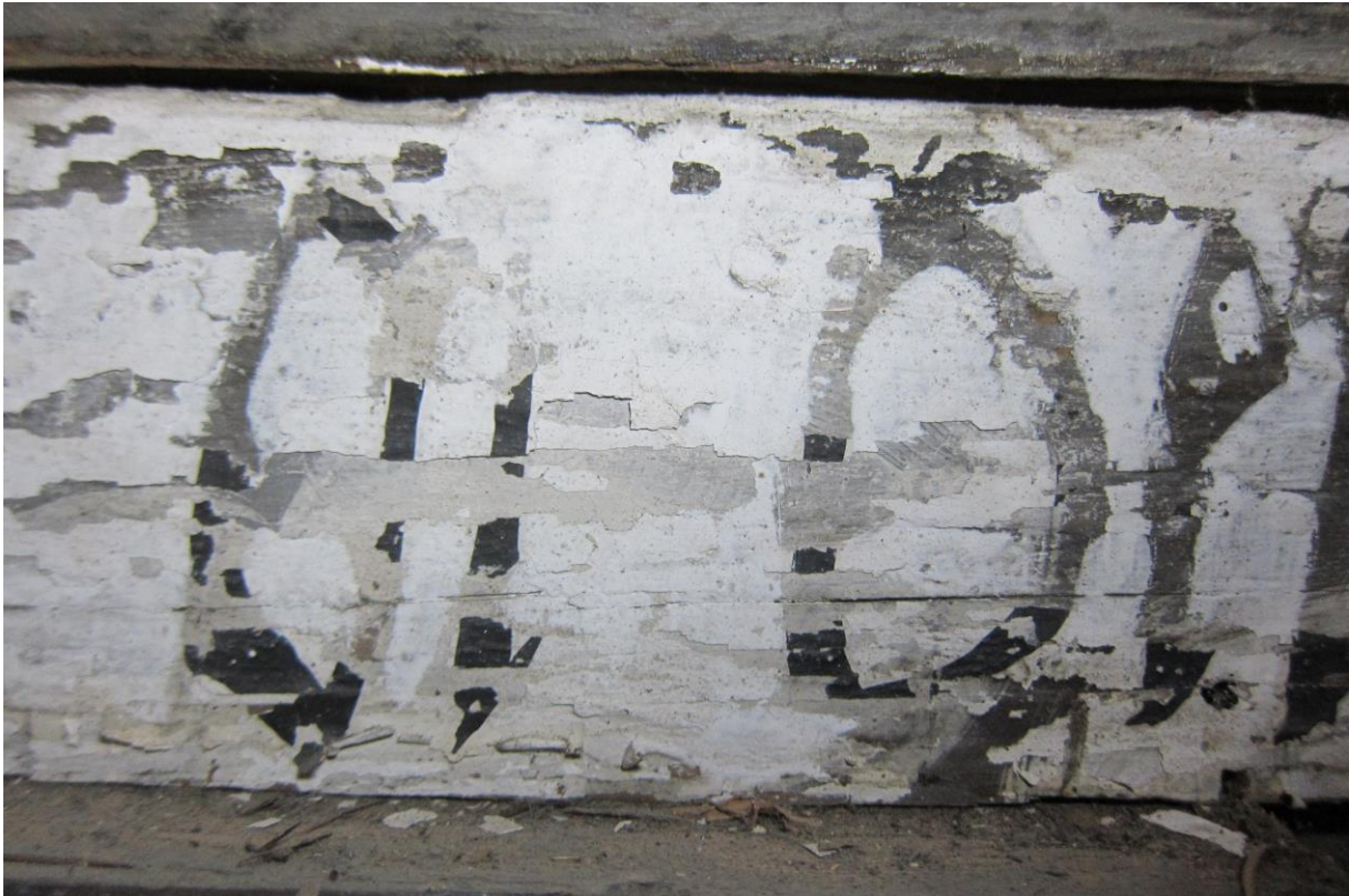
Fig.5 Detaljfoto av tekstfelt på korbuen, mot skipet. Det er omfattende avskallinger, ned til et underliggende lag i forskjellige hvite og grå toner. Gamle retusjer synes som hvite flekker på siden av bokstavene. Det er ikke retusjert med sort, men den grå bunnfargen fyller enkelte steder ut bokstaven.

skadene som limfargen for øvrig. Den reagerer på fukt, noe som viser at den aldri har vært overmalt med oljemaling 9 . I skader på tekstfeltet, kan man observere hvite og mørkegrå farger, som ser ut til å danne store buede linjer, kanskje skyer 10 . Retusjer i disse skadeområdene er gjort forsiktig. Det er bare den hvite bakgrunnsfargen som har blitt malt opp, slik at den grå fargen fra malingen under danner skriften. En sort linje nederst mot nord, tyder på at dette skriftfeltet opprinnelig var tilpasset en mindre åpning mellom kor og skip, som ble revet på 1860-tallet.