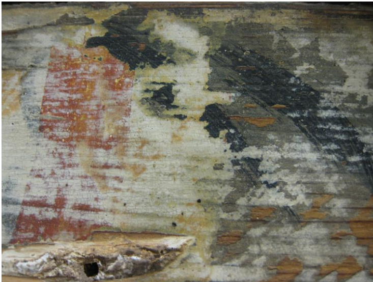
Fig. 2. Detalj av korsketlet på korsiden. Her ser man tydelig at det er to forskjellige limfargededekorlag. Den innerste har en grå bunnfarge med kraftige sorte konturstreker, mens det overliggende laget ligger på en gulhvit bunn med røde streker.

Også her er det stor grad av retusjering. Korsketlet på korsiden har malingrester fra to oppmalinger, samt et tekstfelt i midten. Det er papirrester under dekoren både på østveggen og på korsketlet. Papiret er trolig lagt på for å dekke over ujevnheter i veggen.