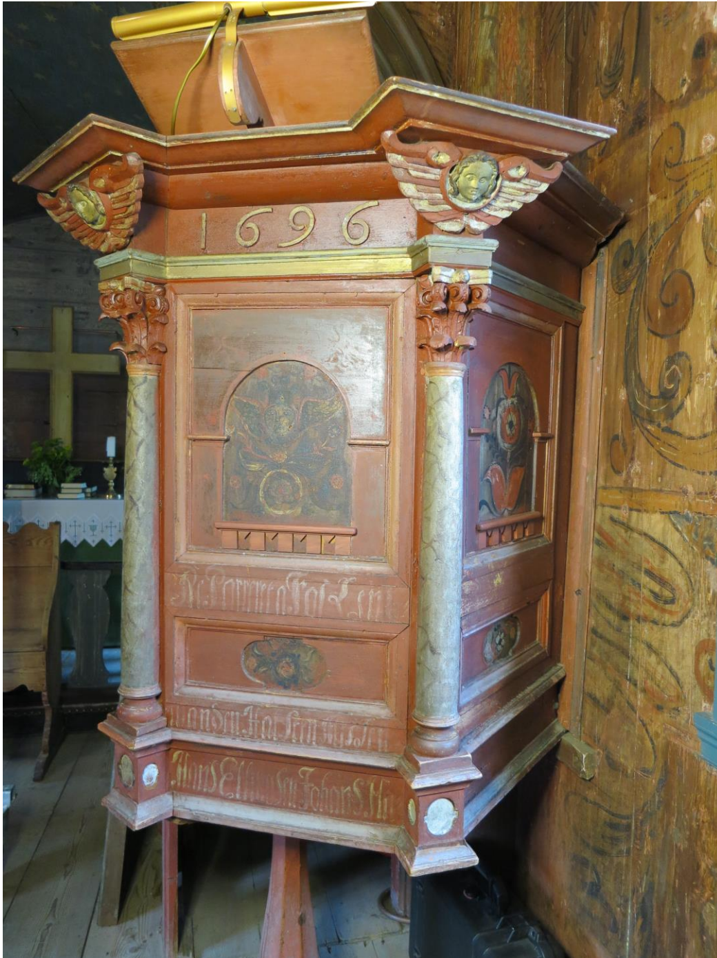
Fig. 6 Detaljfoto av prekestolen etter konservering.

Prekestolen har tre sider vendt mot menigheten, som er skilt fra hverandre med søyler. Den er hovedsakelig malt i brunrødt, med dekor i rødt, hvitt, brunt og gult med svarte konturer. Søylen er marmorert i grågrønne farger. På nordsiden av prekestolen, står det «Anno 1696» («o»-en mangler)