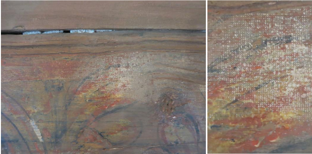
Fig. 8 og 9 Detaljfoto, av merker etter lerret på veggen i koret. Bildet til høyre er en detalj av bildet til venstre.

Det er merker på veggdekoren, enkelte steder på nordveggen etter et lerret som nå er fjernet.