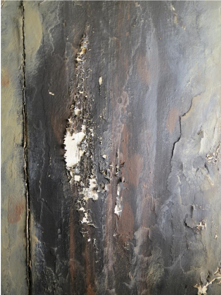
Fig. 10: Detalj av nordre del av kormaleriet. Her kan man se hvordan malingen nærmest krøller seg i kanten av skadene.

Kormaleriet hadde små krøllete oppskallinger i nordre del av maleriet og en del utfall ned til en tykk hvit grundering. Det var noe løst kitt i søndre del av maleriet i en større sprekk mellom plankebordene. Skriftfeltet under kormaleriet hadde mye løs maling.