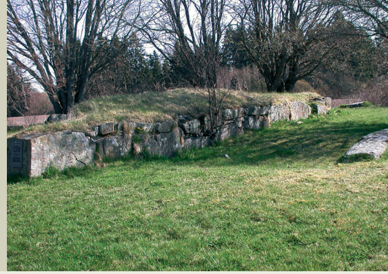
Tenor kirkeruin i 2005.