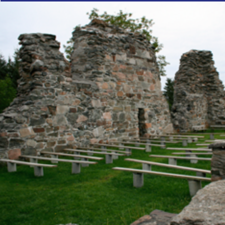
Også i dag brukes kirkeruinen.