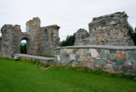
Rester av kirkens vegger.