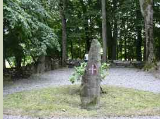
Værne kloster før trærne er felt. Bautastein med malteserkors i forgrunnen (V-Ø)