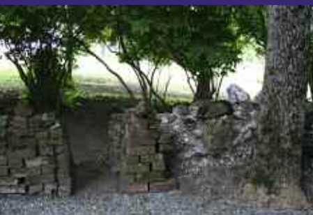
Detalj bilde av teglsteinsmur (S-N)