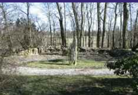
Oversiktsfoto av klosterruinen etter at trærne er felt (V-Ø)