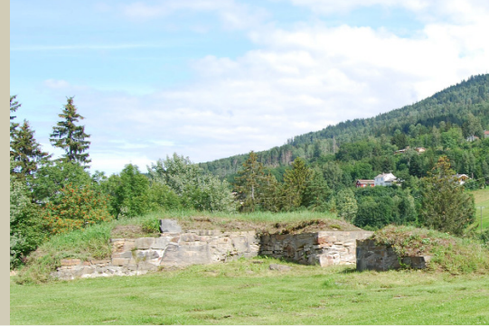
Ruinen sett mot nord-aust.