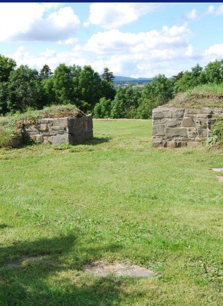
Kor og korponing mot vest.