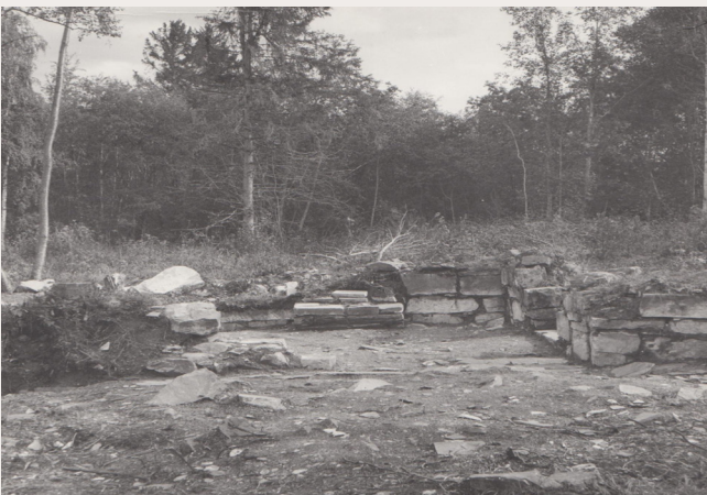
Ruinen etter utgraving, ca 1975.