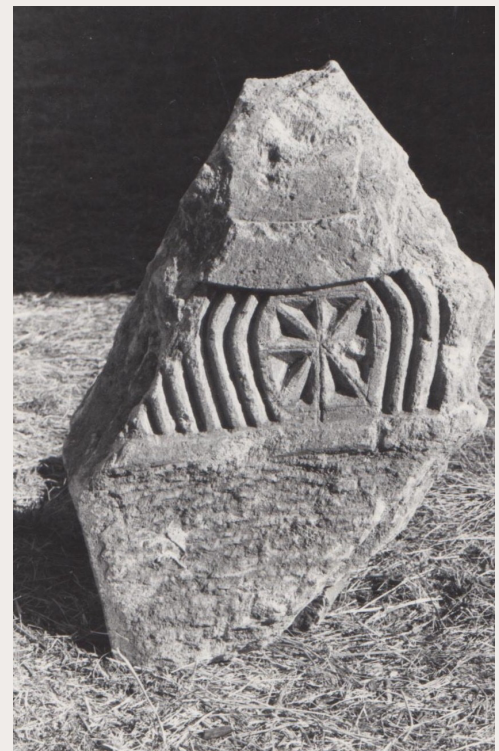
Del av hjulkorsgravstein med "sunken star".