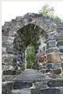
Rekonstruert vindaug mot aust.