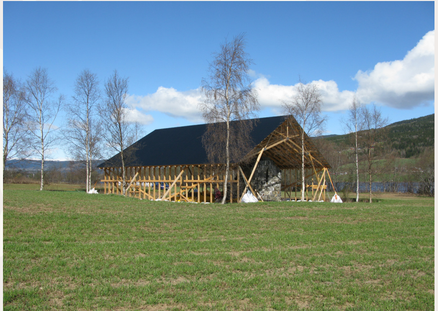
Overbygg sett opp i samband med konservering. Overbygget skal takast ned når arbeidet er avslutta i 20110

Ved Mo kyrkjeruin passer salmen "Kirken den er et gammelt hus, står om enn tårnene faller".