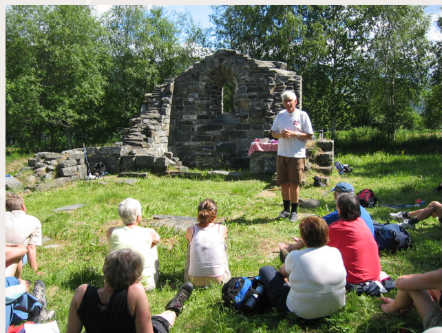
Samlingsstund for pilegrimar.

Heile omriset av kyrkja har kome klart fram. Veggen bak altaret er murt opp att med ein gotisk vindaugsopning.