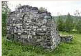
Mo kyrkjeruin sett frå aust.