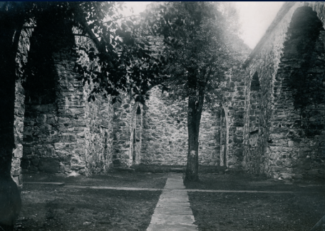
Ruinenes innside mot øst etter arbeidene i 1935-36. Store trær som sto inne i ruinene ble senere fjernet under Håkon Christies utgravninger i 1958.