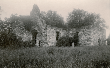
Oversiktsbilde av kirkeruinene før restaureringen i 1925.

Skipet sett mot øst. Østgavlens murverk har omfattende skader. I 2004 ble det satt opp en midlertidig støtte for å hindre nedrasing av stein.