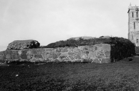
Tilstanden i 1932.