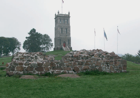
Teglkastellet ferdig konservert, 2006.