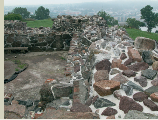
Detalj bilde av konservert murverk, 2006.