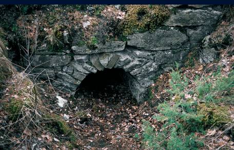
Vindusåpning i søndre mur.