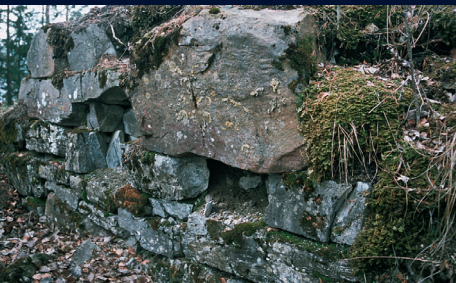
Utglidd stein i østmuren.