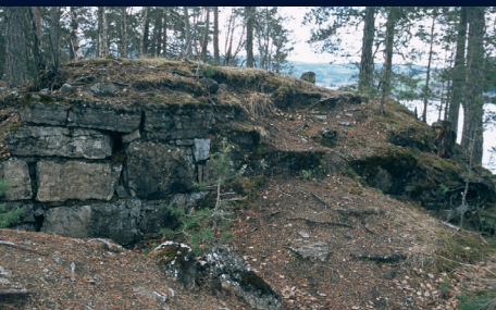
Sørvestre del av kastellet sett innenfra.