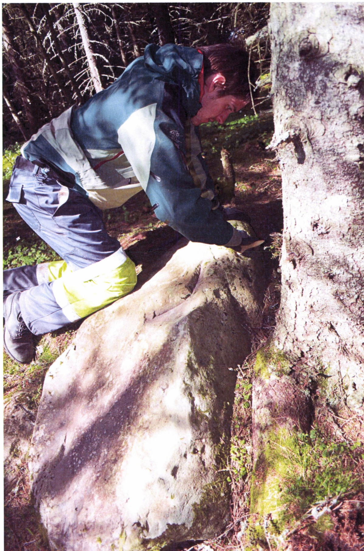
Skjerdingsstad IV renses av Rune Normann