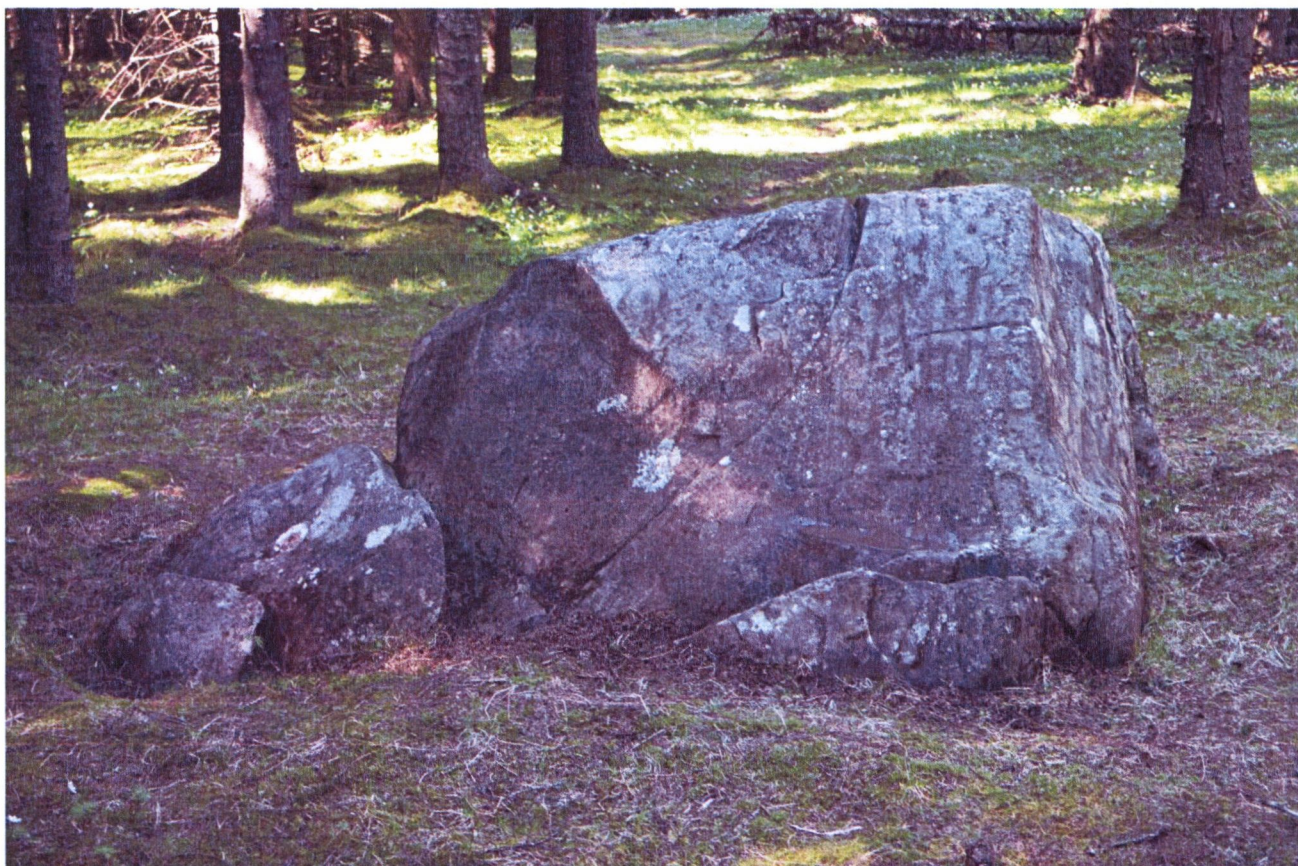
Skjerdingsstad I, felt B mot vest, før og etter rens.