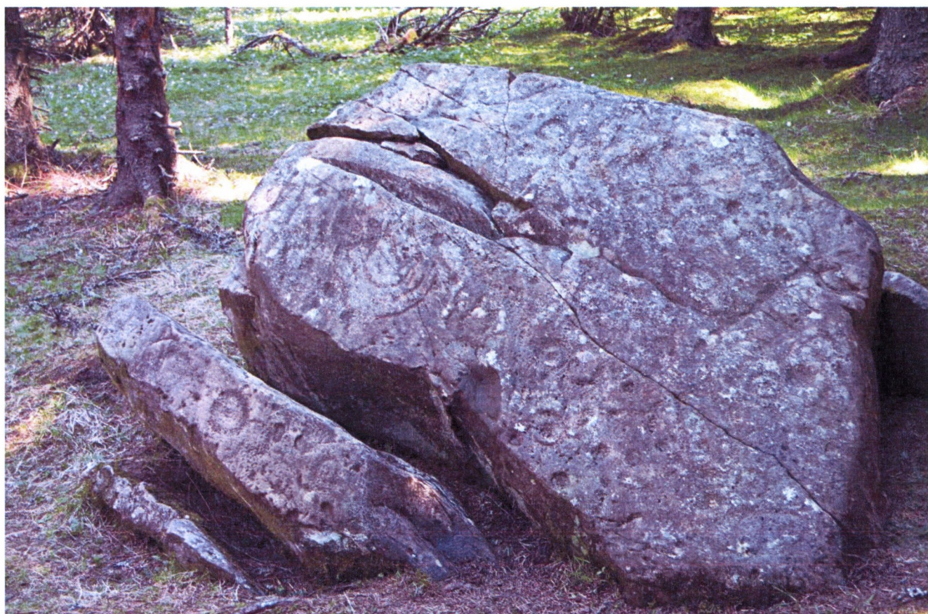
Skjerdingsstad I, felt A mot øst, før og etter rensing. Skorpelavene er vanskelige å fjerne uten spriting og tildekking.