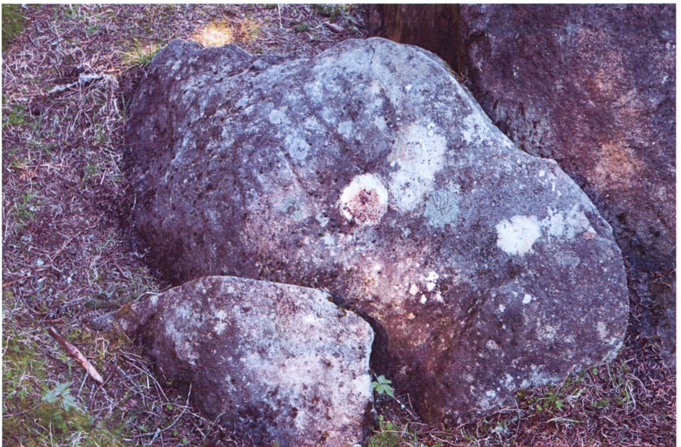
Skjerdingsstad I, felt C mot nord, før og etter rens.