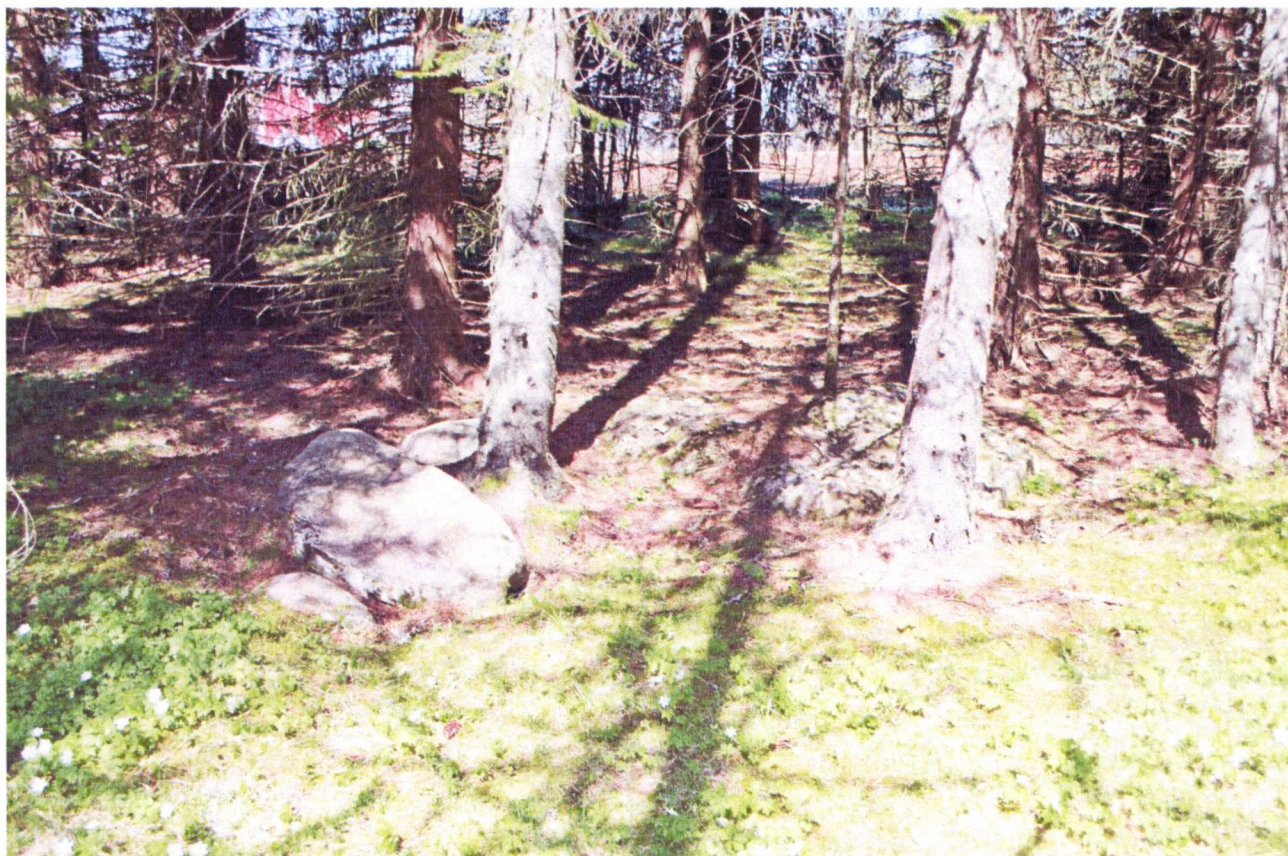
Oversikt Skjeringstad III-VI før og etter rens