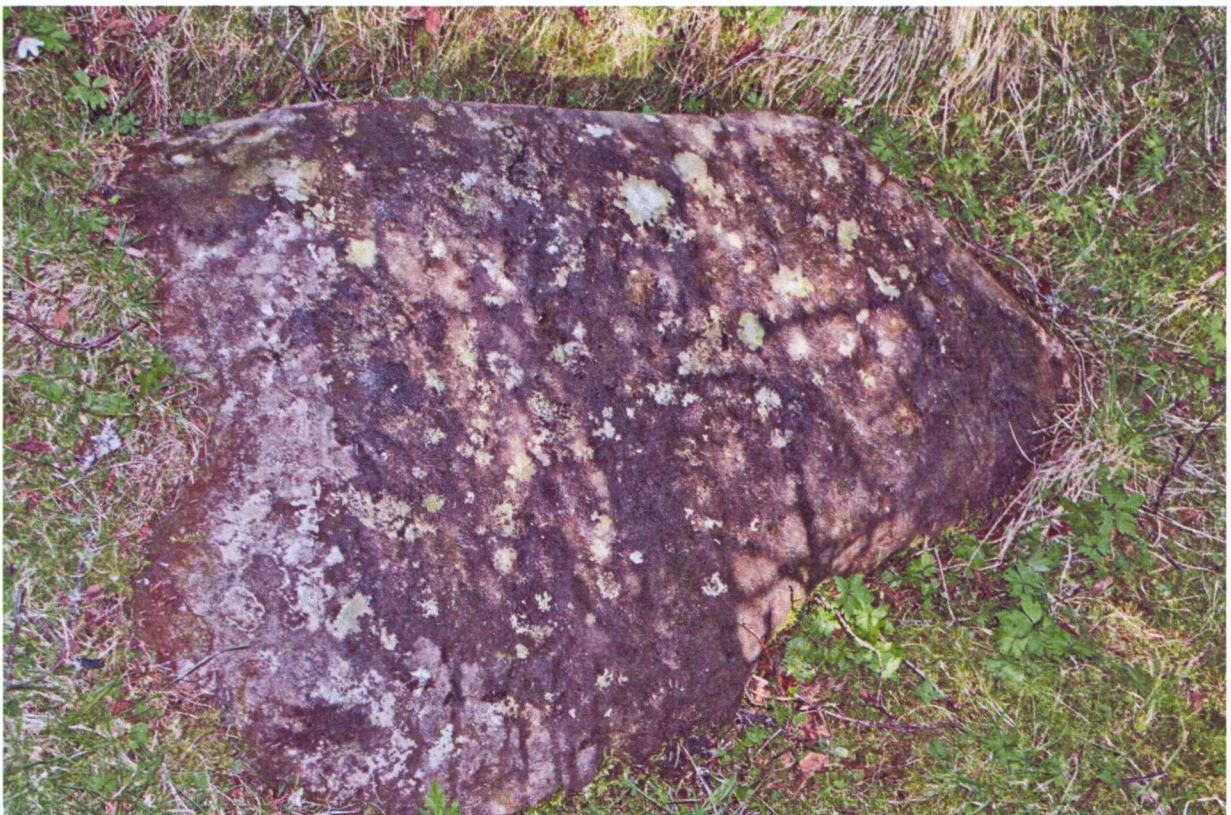
Skjerdingsstad II, før og etter rens.