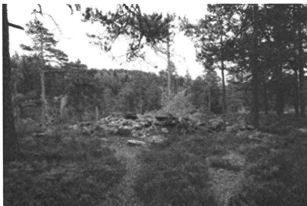
Gravrøys i Brastadåsen i Lier kommune – skiltet i 2011

Oppsetting av et kulturminneskilt er med andre ord et prosjekt som krever mye forarbeid før selve skiltet er på plass. Dette er imidlertid absolutt nødvendig. Det er en kvalitetssikring for ivaretagelsen av kulturminnet og vedlikehold av skilt og formidlingsarena. Opplevelsen av kulturminnet og historien som vi ønsker å fortelle forringes kraftig dersom skjøtselen ikke gjennomføres.