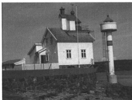
Filtvet fyr ligger i Hurum kommune - det ble bygd i 1877 og fredet i 1997. Kulturminnet ble skiltet i 2011.

Tiltak skal ikke iverksettes før prosjektet er fullfinansiert.