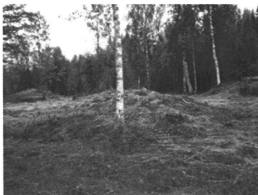
Frygve gravfelt i Nore og Uvdal kommune – skjøttsarbeid med rydding av vegetasjon i gang

Det må utarbeides forpliktende skjøttsplaner og skjøttsavtaler for kulturminnet og skiltet. Dette må på plass før skiltet settes opp. Gode avtaler er avgjørende for at opplevelsen av kulturminnet og stedets historie blir slik vi ønsker. Det finnes dessverre flere eksempler på skilt som er oppsatt med de aller beste intensjoner, men der det etter kort tid oppleves gjengroing og forfall. For å unngå dette skal det utarbeides skjøttsplaner som inneholder informasjon om kulturminnet eller kulturmiljøet, tiltak som skal gjennomføres, ansvarsfordeling – hvem gjør hva av skjøtselstiltak, finansieringsplan for skjøtselen og framdrift/tidsplan for arbeidet. Skjøttsplanen blir gjort bindende mellom partene gjennom skjøttsavtalen. Skjøttsplanen utarbeides av fylkeskommunen i samarbeid med den/de som skal gjennomføre det praktiske skjøttsarbeidet.