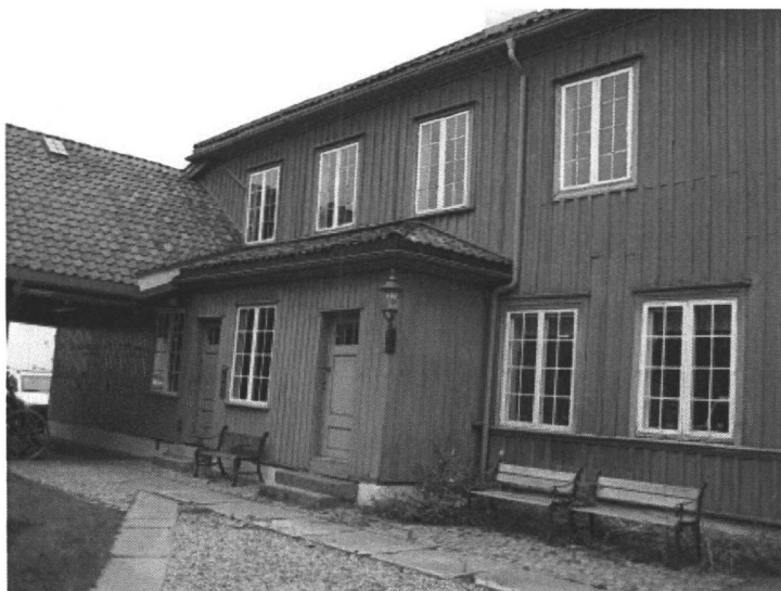
Tollbugata 54 – Cappelengården - Drammen kommune – detalj av fredet gårdsanlegg som er en del av gamlebyen i Drammen fra 1700-tallet

Det vil ikke bli laget noen prosjektorganisasjon for å gjennomføre disse tiltakene. I fylkeskommunen vi teamkoordinator for team kulturminnevern ha hovedansvar for at framdriften holdes. Gjennomføring av skilttiltakene skjer ved samarbeid mellom saksbehandlerne for de ulike fagområdene arkeologi/nyere tids kulturminnevern i fylkeskommunen og kontaktperson i kommunene. Listene over planlagte kulturminneskilt og oppsatte kulturminneskilt (se nedenfor pkt. 7 og 8) vil oppdateres årlig.