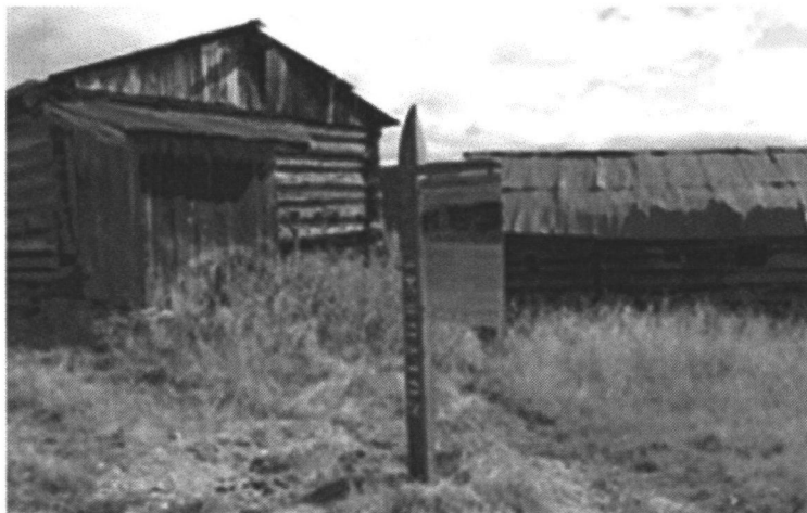
Kulturminneskilt ved gamle seterbygninger på Haglebu – Haglebu kultursti

Målet er at alle planlagte tiltak gjennomføres i løpet av prosjektperioden. Det tidfestes ikke ferdigstillestidspunkt for enkeltprosjekter. Målet er å gjennomføre minimum fem skiltprosjekter årlig.