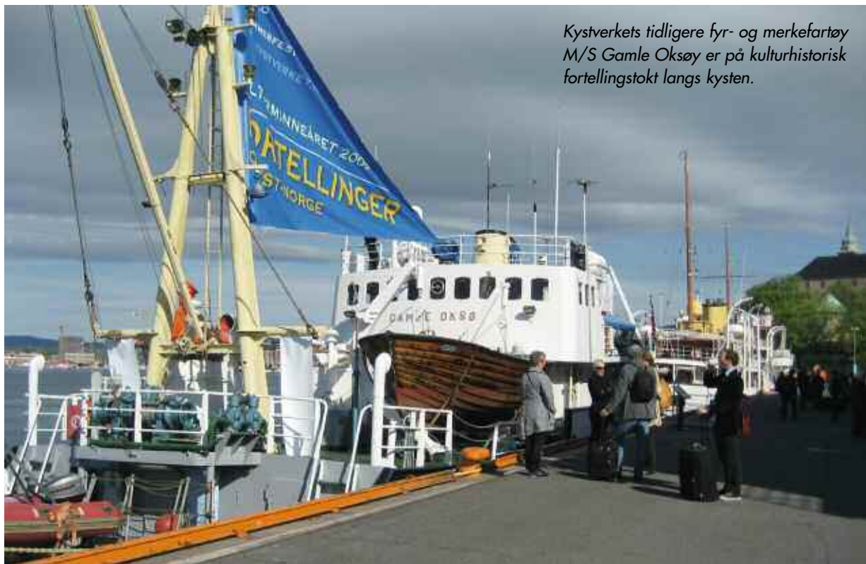
Kystverkets tidligere fyr- og merkefartøy M/S Gamle Oksøy er på kulturhistorisk fortellingstokt langs kysten.