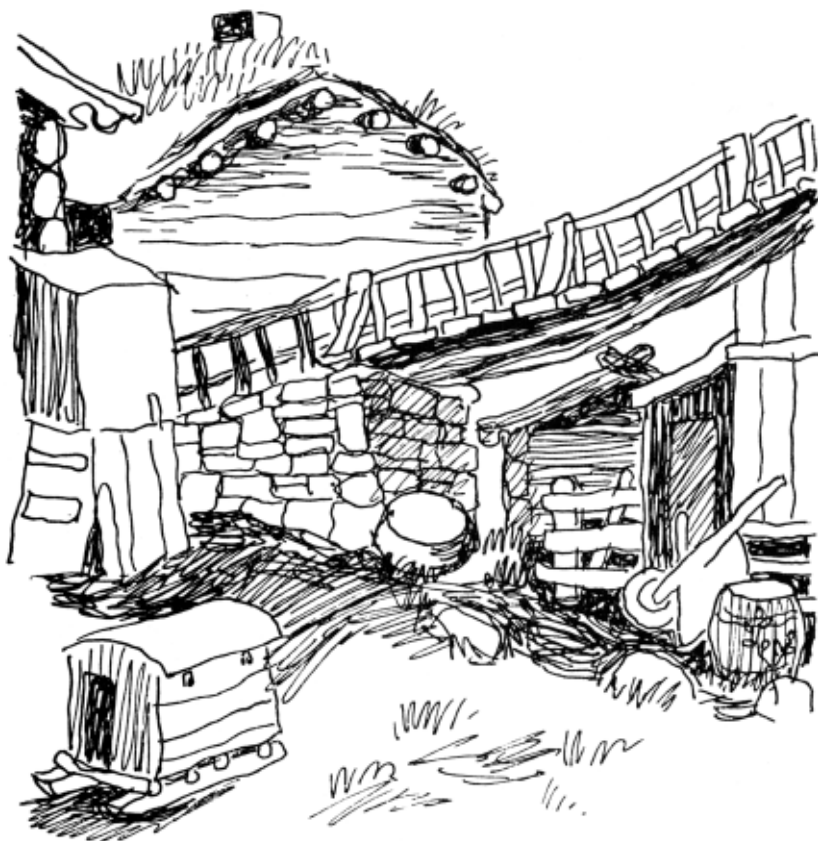
Thorbjørn Egner: Kleppe gård