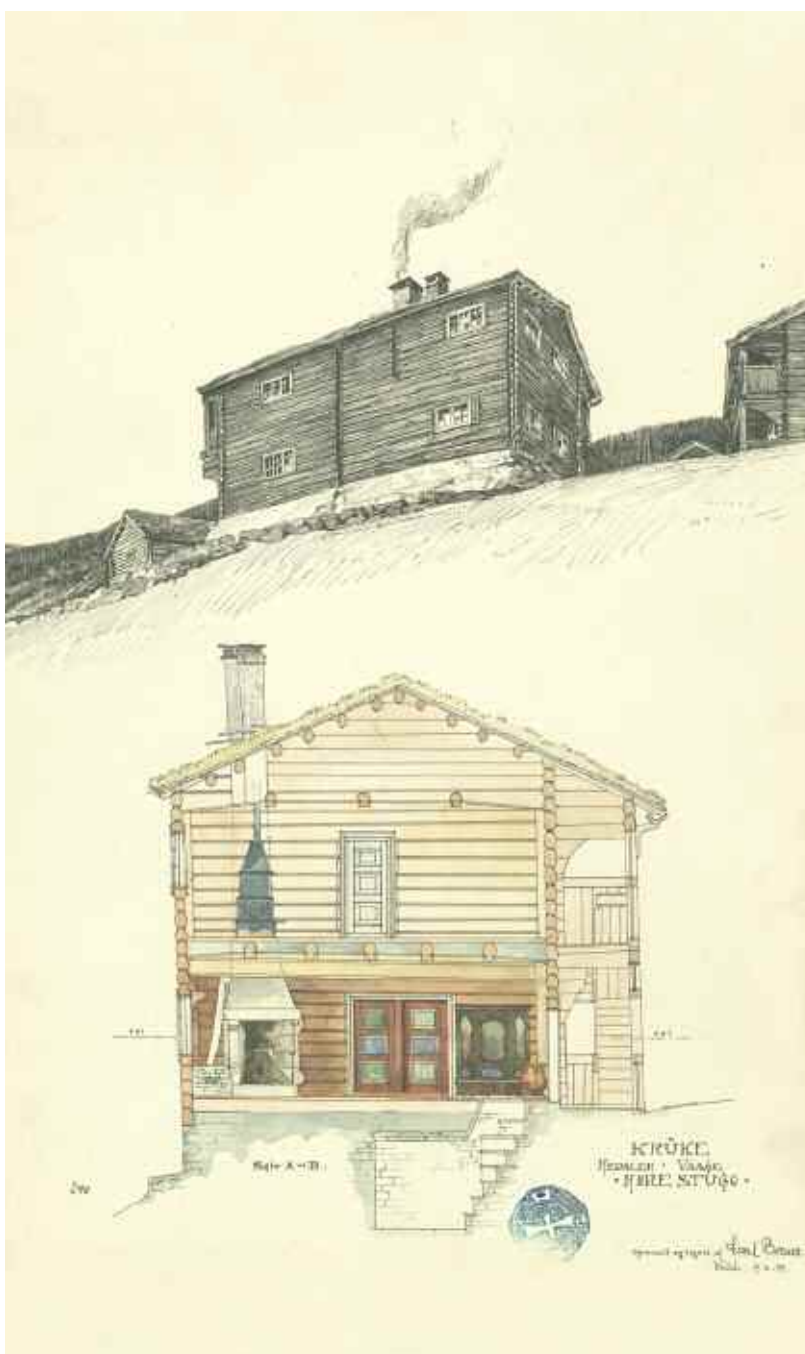
KRÜKE. Hjemlandet. Vaaen. • NØRE, STUØØ • Opmaalt og tegnet af Herman Major Schirmer

Som en del av Kulturminneåret 2009 samarbeidet Lillehammer