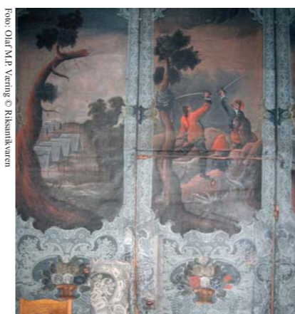
I frihåndsdekor er det malt krigsscener på lerretstapetet fra 1760. Fra salen i 1. etasje

Vi står på tunet i skyggen av det store eiketreet. Bak oss har vi låven,