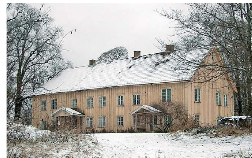
Skrivergården Hovin Østre.

til venstre det store stabburet, og rundt huset ligger en vakker hage, omtrent slik den var i 1915. Rundt 700 dekar jord har gården i dag, hvorav 400 blir brukt til kornproduksjon.