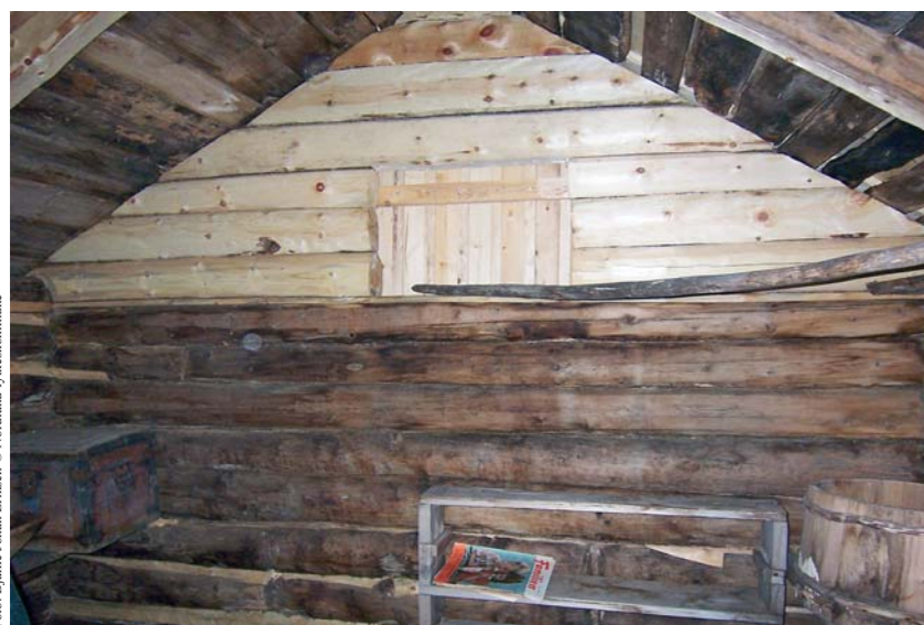
Staburet på Ljønes. Ferdig reparert høst 2006.