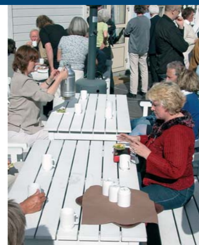
Spente private eiere samlet i hagen til Lillesand hotell