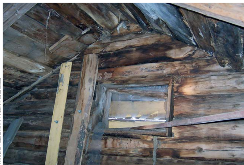
Stabbur på Ljønes fra 1586. Bodø kommune.

Utfordringen etter at denne prosjektperioden er over, blir å etablere et program for å vedlikeholde bygningene.