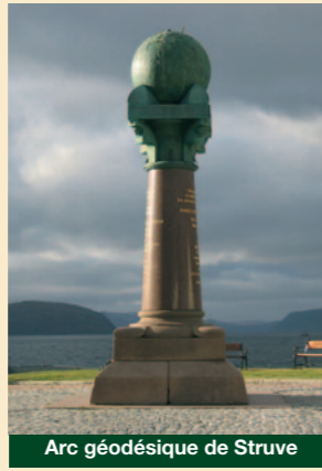
Arc géodésique de Struve