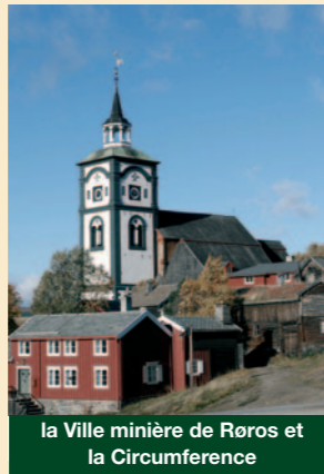
la Ville minière de Roros et la Circumference