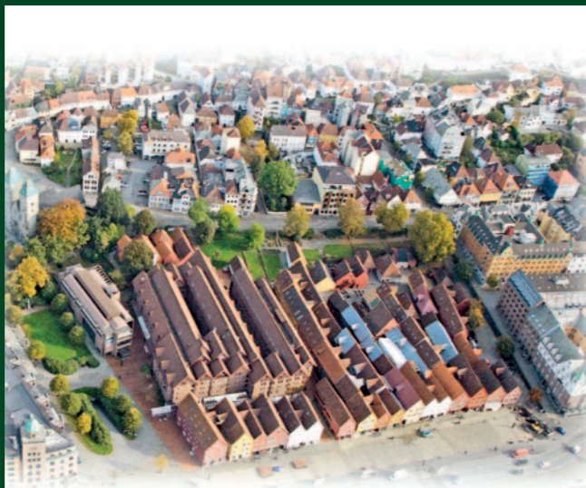
Ill.: Directorate for Cultural Heritage/Tor Sponga

Conception/maquette: Grimshaug Grafiske, Lørenskog - Impression: HBO As 06/18