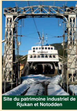
Site du patrimoine industriel de Rjukan et Notodden