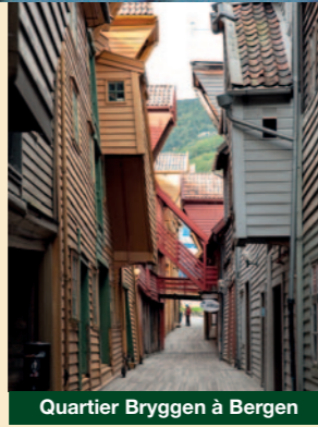
Quartier Bryggen à Bergen

Le Conseil pour l'héritage culturel (Riksantikvaren) et le Conseil pour l'environnement (Miljødirektoratet) représentent la Norvège au Comité du patrimoine mondial de l'UNESCO.