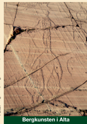
Bergkunsten i Alta