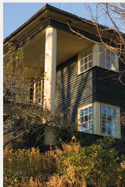
Detaljene betyr mye for opplevelsen av en bygning. Reisverksbygning i Oslo

Se også egen veileder om energieffektivisering.