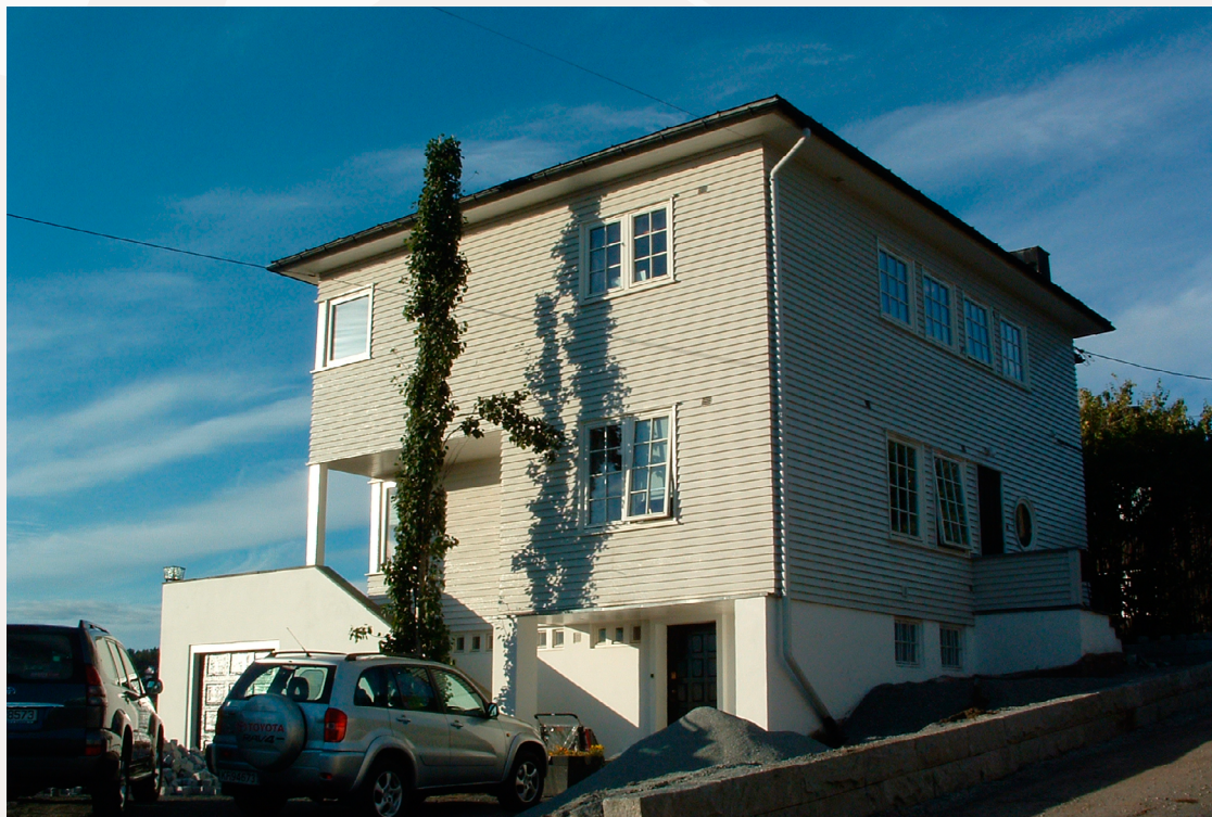
Villa fra 1934 oppført i reisverk. Materialbruk, dimensjoner og detaljeringen er viktig for opplevelsen av denne bygningen.

Egenskapene til en bygning er avhengig av bygningstype. I dette informasjonsarket ser vi nærmere på forskjellige tiltak for å spare energi i verneverdige bygninger oppført i reisverk. Hvor skjer vanligvis varmetapene i en bolig oppført i reisverk, og hvor stor energisparingseffekt gir de ulike utbedringstiltakene? De andre arkene i serien viser det samme for andre typer bygg. Hensikten med disse gjennomgangene er å gi eiere, konsulenter og håndverkere bedre grunnlag for å velge riktige energieffektiviseringstiltak.