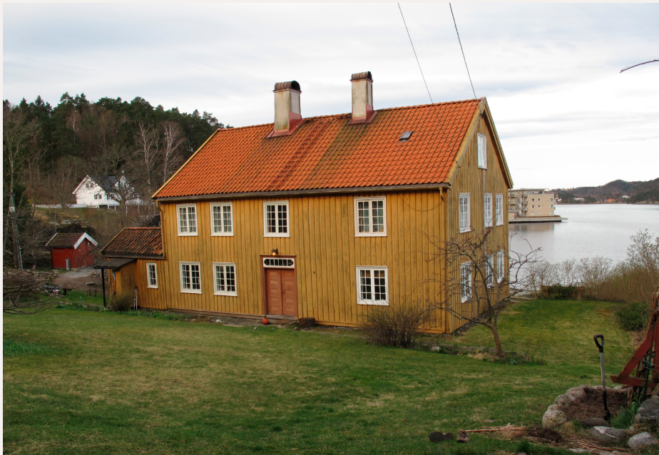
Laftet panelt bolighus, Tromøya.