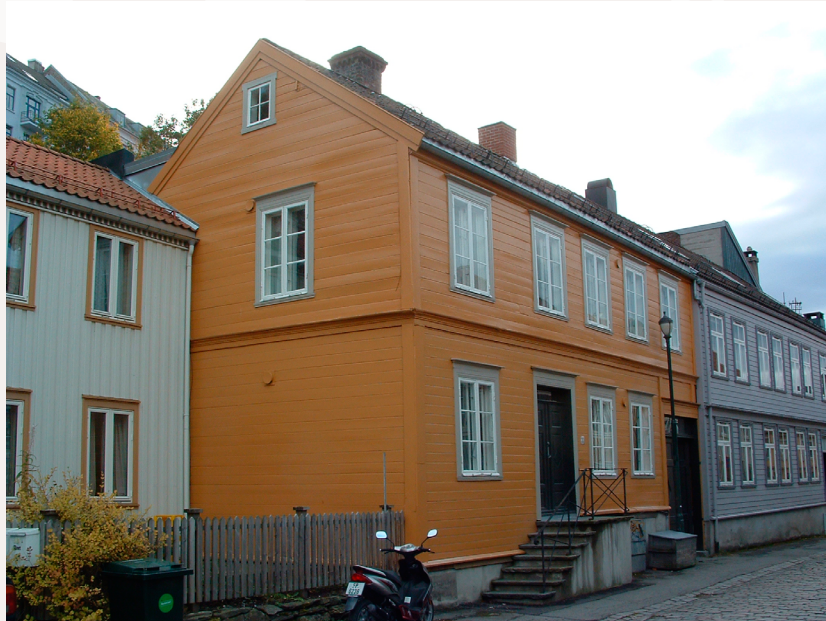
Panelt laftebygning på Baklandet i Trondheim.

Egenskapene til en bygning er avhengig av bygningstype. I dette informasjonsarket ser vi nærmere på forskjellige tiltak for å spare energi i verneverdige bygninger oppført i laft. Hvor skjer vanligvis varmetapene i en bolig oppført i bindingsverk, og hvor stor energisparingseffekt gir de ulike utbedringstiltakene? De andre arkene i serien viser det samme for andre typer bygg. Hensikten med disse gjennomgangene er å gi eiere, konsulenter og håndverkere bedre grunnlag for å velge riktige energieffektiviseringstiltak.