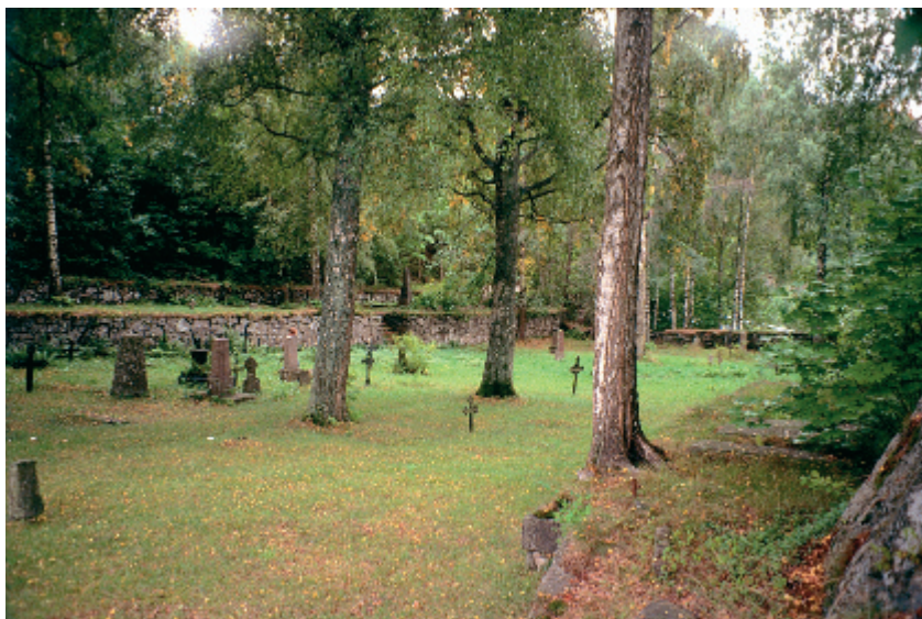
Bråthen kirkegård i Kragerø var i bruk på midten av 1800-tallet, og har varierte gravminnetyper fra denne tiden. Terrasser med natursteinsmurer ble bygget for å gi tilstrekkelig gravdybde langs fjellskråningene. Varsomt vedlikehold uten overdreven gressklipping bidrar vesentlig til stemningen i det bevaringsverdige anlegget.

ut for bevaring, vanligvis det området som ligger nærmest kirken. Det er vanligvis dette området som er automatisk fredet etter kulturminneloven dersom det var kirkegård på stedet i middelalderen. På middelalderkirkegårder der gravlegging nærmest kirken i dag har opphørt, er det ønskelig at området reguleres til bevaring og at gravlegging ikke gjenopptas. De mest attraktive gravplassene var vanligvis i området syd og øst for kirken. Det er derfor ofte her man finner det mest særpregete gravutstyret fra forskjellige perioder langt tilbake. Dersom man velger ut området nærmest kirken for bevaring, får man sikret både en helhet og kirkens innramming i miljøet . Dermed sikrer man også kirkens nærmiljø mot store inngrep forårsaket av maskinell kirkegårdsdrift. I tillegg til et slikt sammenhengende bevaringsområde, bør man også vurdere bevaring av enkeltgravminner på resten av kirkegården slik at man også for fremtiden vil ha eksempler på de forskjellige gravminnetyper som finnes.