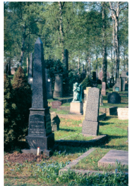
Gamle kirkegårder særpreges av variasjon i monumenttyper, gravplassering og vegetasjon. Vår Frelses gravlund i Oslo.

Det vil som regel være den eldste delen av kirkegården som peker seg