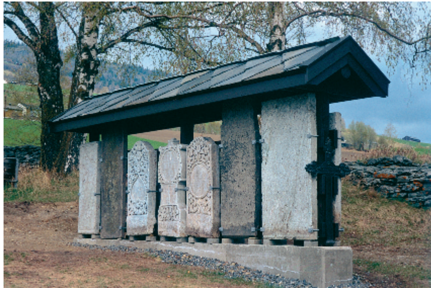
På Sør-Fron kirkegård er verdifulle gravminner i løse bergarter fra slutten av 1700-tallet og begynnelsen av 1800-tallet sikret under tak.

rer må sikres i tide ved overdekning, enten på stedet eller ved at de bringes under tak annet sted. Ofte kan plassering under et stort takutstikk på ytterveggen av en bygning tilknyttet kirkegården være den minst skjemmende løsningen. Tradisjonelt har kirketårn og kirkeloft vært en vanlig oppbevaringsplass, men disse stedene har begrenset tilgjengelighet dersom gjenstandene fortjener fremvisning.