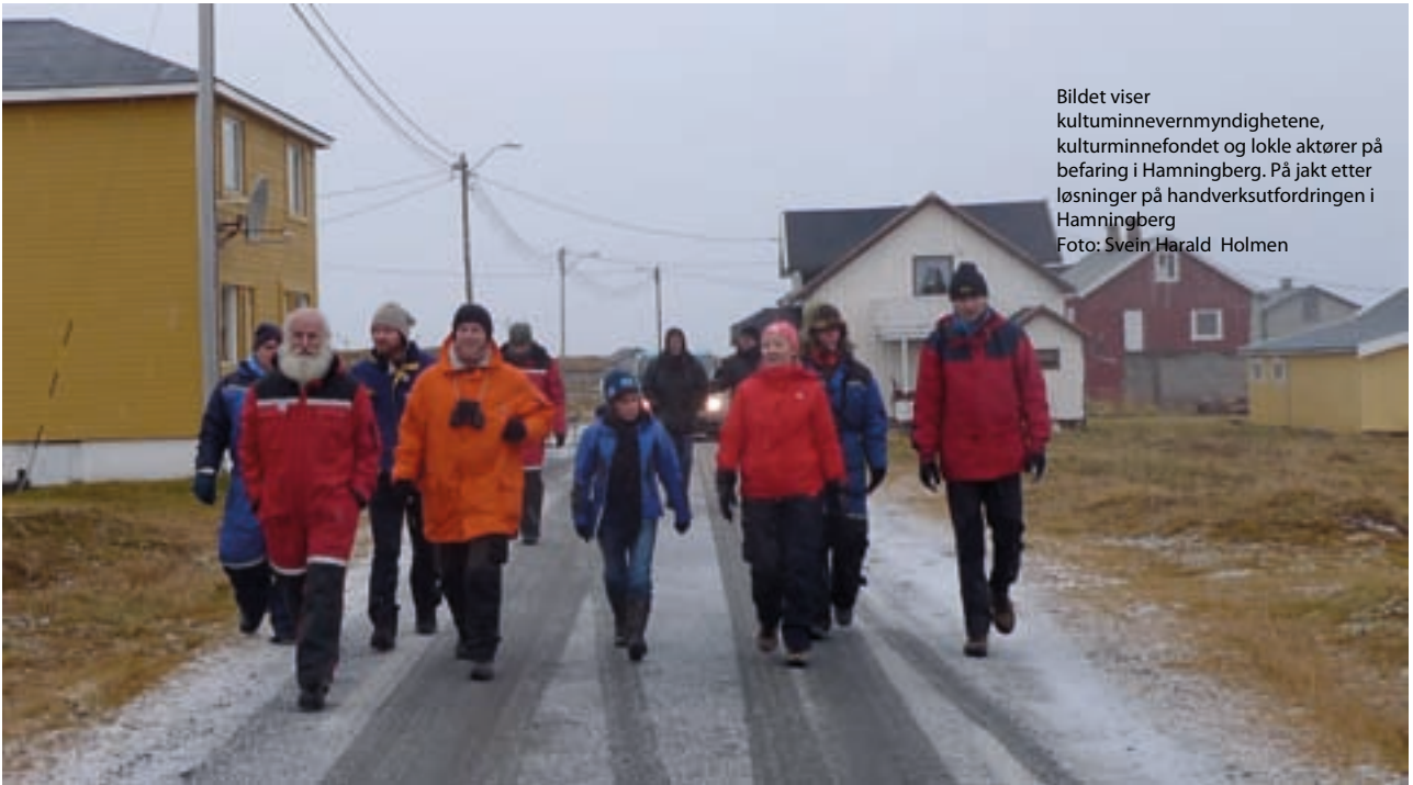
Bildet viser kultuminnevernmyndighetene, kulturminnefondet og lokale aktører på befaring i Hamningberg. På jakt etter løsninger på handverksutfordringen i Hamningberg