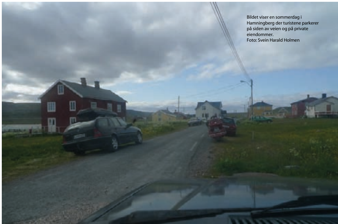
Bildet viser en sommerdag i Hamningberg der turistene parkerer på siden av veien og på private eiendommer.