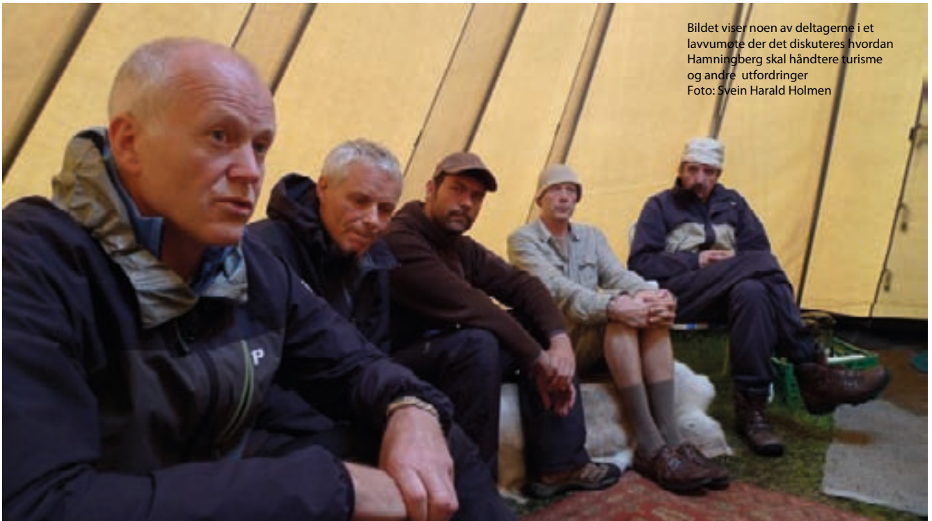
Bildet viser noen av deltagerne i et lavvumøte der det diskuteres hvordan Hamningberg skal håndtere turisme og andre utfordringer

Prosjektgruppen startet sitt arbeide med veldig ulikt utgangspunkt. Statens vegvesen, som var delprosjektleder for parkering, jobbet på sin måte. Båtsfjord havn, som var delprosjektleder for utdyping av Russekeila, jobbet på en annen måte. Fylkeskommunens kulturminnevernavdeling, med ansvar for håndverkskompetanse og bevaring av bygninger, jobbet på sin måte og fylkeskommunens næringsavdeling, med ansvar for koordinering, på sin måte. Også den lokale prosjektlederen og delprosjektleder med ansvar for lokal forankring, lokal historie, næringsutvikling, samt hager og gjerder jobbet på sin måte. Til å begynne med førte dette til at hele prosjektet bokstavelig talt gikk i vidt forskjellige retninger og på vidt forskjellig vis, uten noen felles forståelse for hvordan en skulle komme sammen i mål.