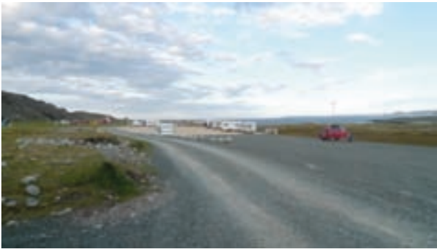
Bildet viser parkeringsplassen i Hamningberg som nå blir flittig brukt av tilreisende biler, busser og bobiler. Til stor glede for folk i Hamningberg

Hamningbergs største utfordring og utgangspunkt for ønske om å delta i verdiskapningsprogrammet, var trafikkregulering av bygda. Hamningberg er blitt svært slitt av all bil-, buss- og bobiltrafikken. Sår og skader i terrenget, samt motorstøy og visuell forøpling var konsekvensen. Løsningen ble en parkeringsplass utenfor bygda. Denne ble bygd i 2008 og har resultert til at mesteparten av belastningen nå er tatt bort fra selve bygda.