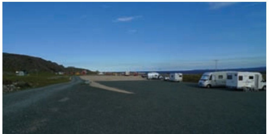
Bildet øverst viser Hamningberg rorbuer AS sitt anlegg. Bildet over viser parkeringsplassen. Utbyggingen av reiselivlegget krever også at det legges til rette lokalt for å unngå for stor belastning på naturen og på beboerne.

Dette illustrerer et viktig poeng. I Hamningbergprosjektet har det vært fokus på å legge til rette for næringsutvikling ved å styrke fellesgodene som parkeringsplass, rehabilitering av bygningsmasse, utdyping av havneallmenningen og dokumentasjon av historie.