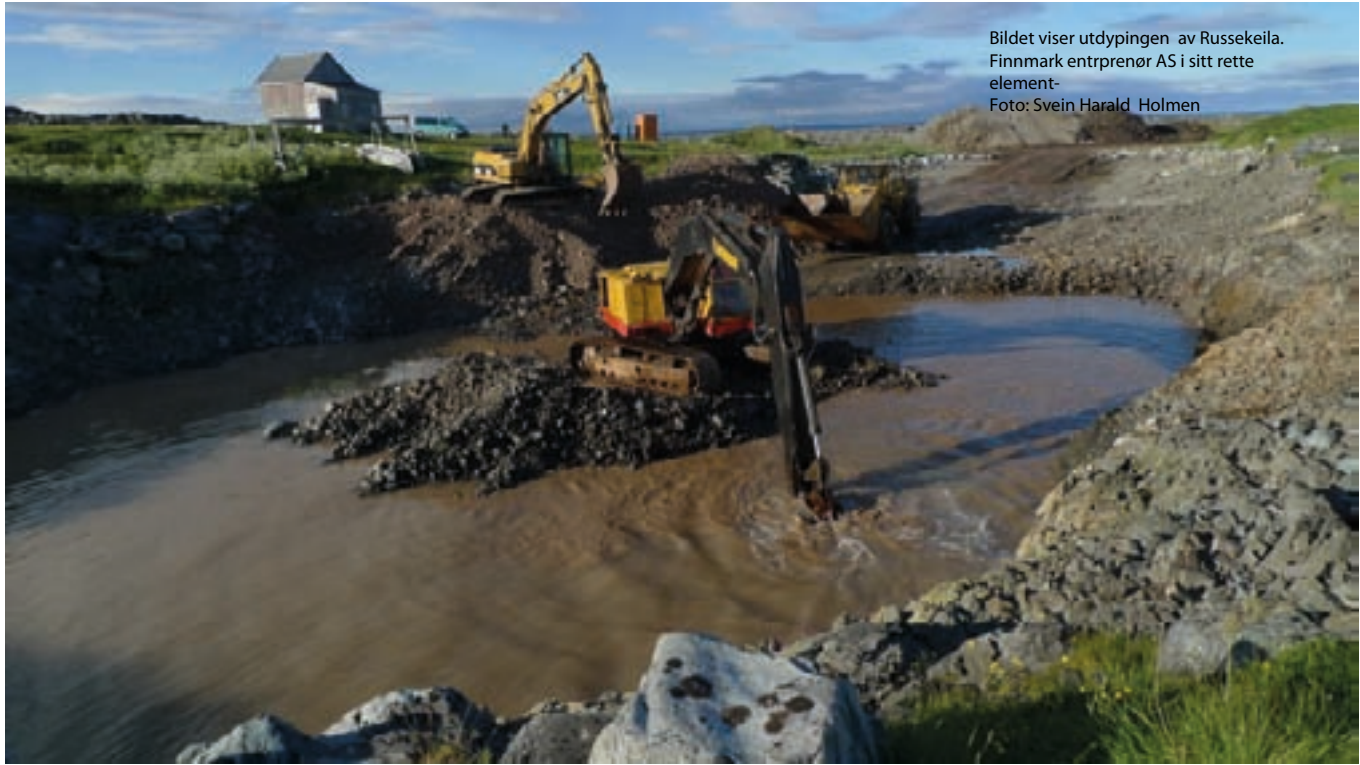
Bildet viser utdypingen av Russekeila. Finnmark entreprenør AS i sitt rette element