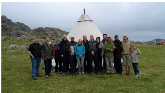
Bildene er fra et lavvu møte i Hamningberg.

Det at prosjektet har hatt lokale personer i sentrale posisjoner helt fra starten av, har ført til at det er blitt bygd opp kompetanse på mange område, og gjennomføringsevne generelt. Det er prosjektledelsens klare oppfatning at dette også har bidratt til et sterkere lokalt engasjement, at beslutninger er truffet på stedets premisser, samt at det har styrket identiteten og tilhørigheten i bygda.