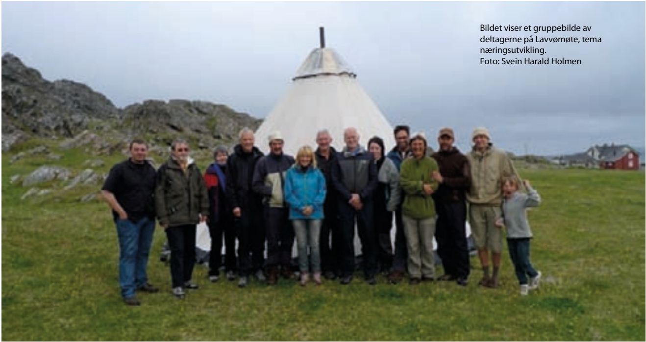
Bildet viser et gruppebilde av deltagerne på Lavvømøte, tema næringsutvikling.

Da prosjektet i Hamningberg ble igangsatt ble det først utarbeidet en prosjektplan. Prosjektet ble delt opp i fem ulike delprosjekter. Det mest sentrale i prosjektplanen var visjonen og handlingsplanen, samt en grunnleggende verdi for prosjektet. Det ble laget målsetninger til hvert av de enkelte delprosjektene. Sammen danner disse mål for prosjektet knyttet til både verdiskaping, bevaring av kulturarven og det å ta vare på og videreformidle kunnskap. Prosjektplanen har ikke vært revidert underveis.