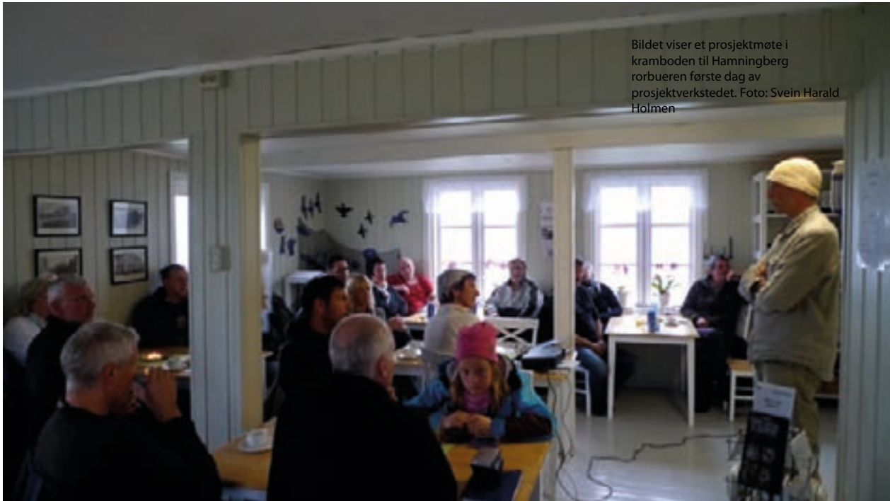
Bildet viser et prosjektmøte i kramboden til Hamningberg rorbueren første dag av prosjektverkstedet.

De har i tillegg sittet med projektansvar for anlegging av parkeringsplassen utenfor bygda, og var tidlig en diskusjonspartner i utformingen av prosjektet. I tillegg har Kystverket vært en aktiv samarbeidsaktør i forbindelse med utdyping av havneallmenningen Russekeila.