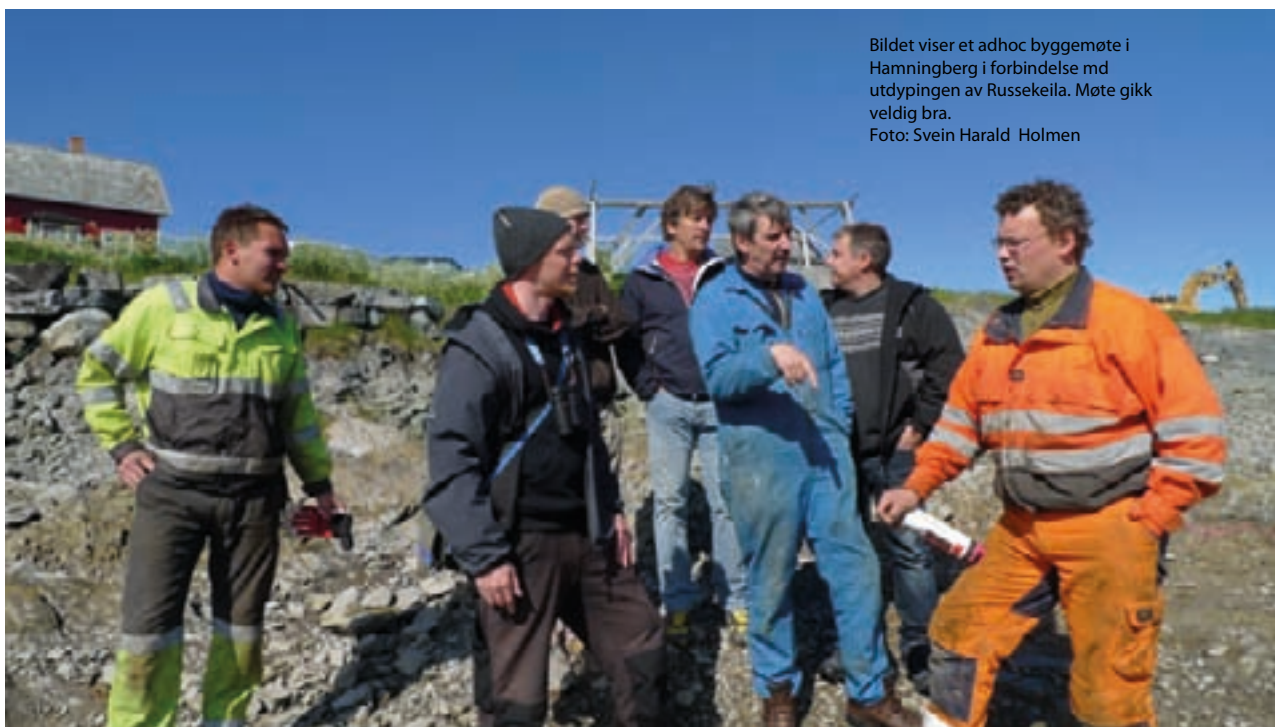
Bildet viser et adhoc byggemøte i Hamningberg i forbindelse med utdypingen av Russekeila. Møte gikk veldig bra.