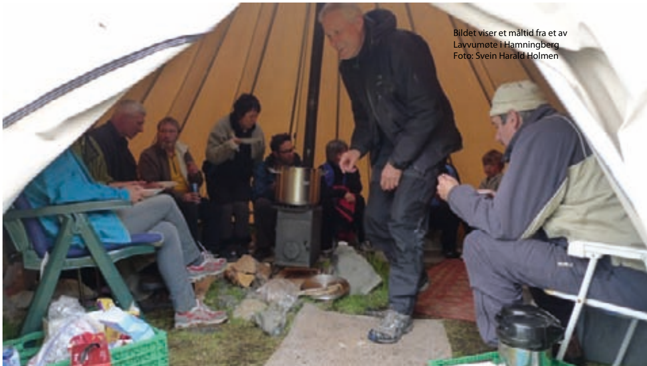
Bildet viser et måltid fra et av Lavvumøte i Hamningberg