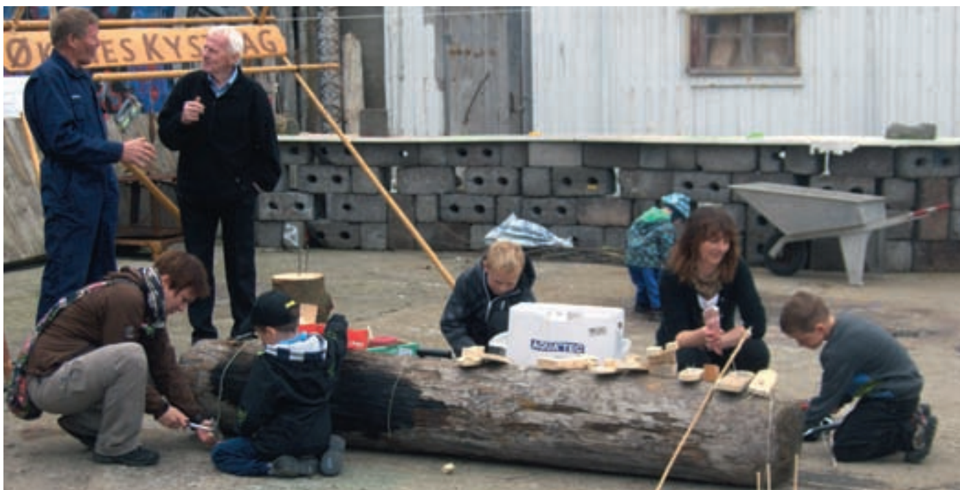
Marmelpasset i praksis.