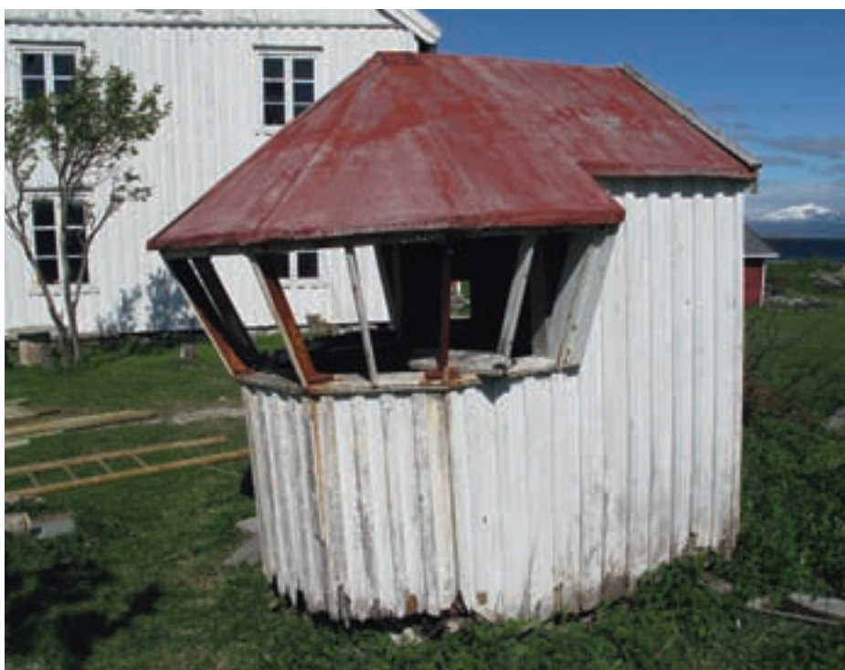
Fyrlykta på Kjeøy.