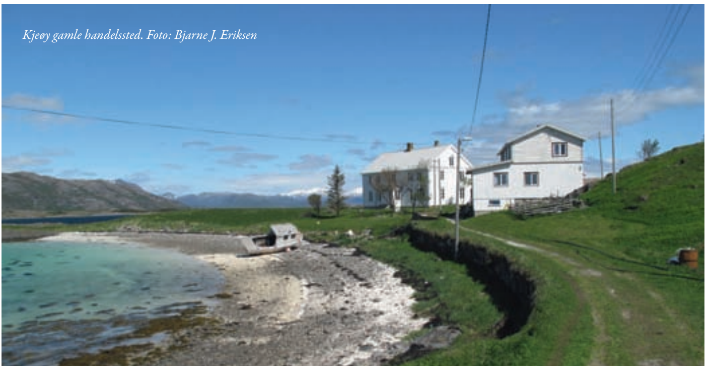
Kjeøy gamle handelssted.