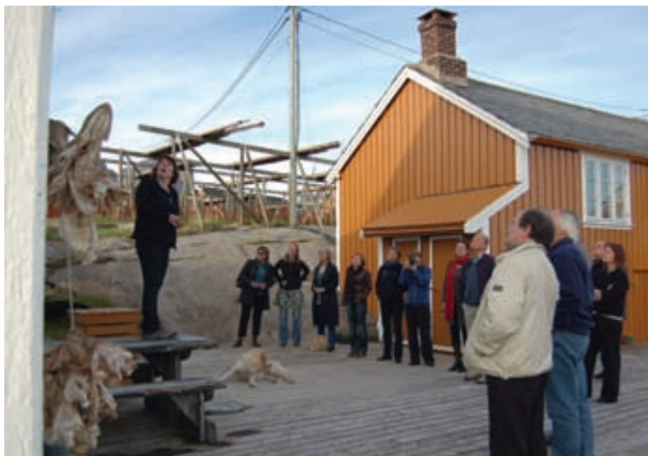
Erfaringsseminar på Sakrisøy i Lofoten

I mai 2007 ble det invitert til det aller første erfaringsseminar, hvor alle som hadde fått støtte, de som ikke hadde fått, virkemiddelapparat, kommuner og øvrige samarbeidspartnere møttes for utveksling av erfaringer med satsingen så langt. Samtidig ble det åpnet for dialog om videre utvikling av programmet. Tilbakemeldingene var stort sett positiv, bortsett fra enkelte aktører som mente det var for mye fokus på næringsutvikling og for lite på kystkultur. Nettverkene har vært en god arena for oppfølging og kobling mellom prosjektledelsen og aktørene, ulike aktører seg i mellom, mellom virkemiddelapparatet og ikke minst i forhold til