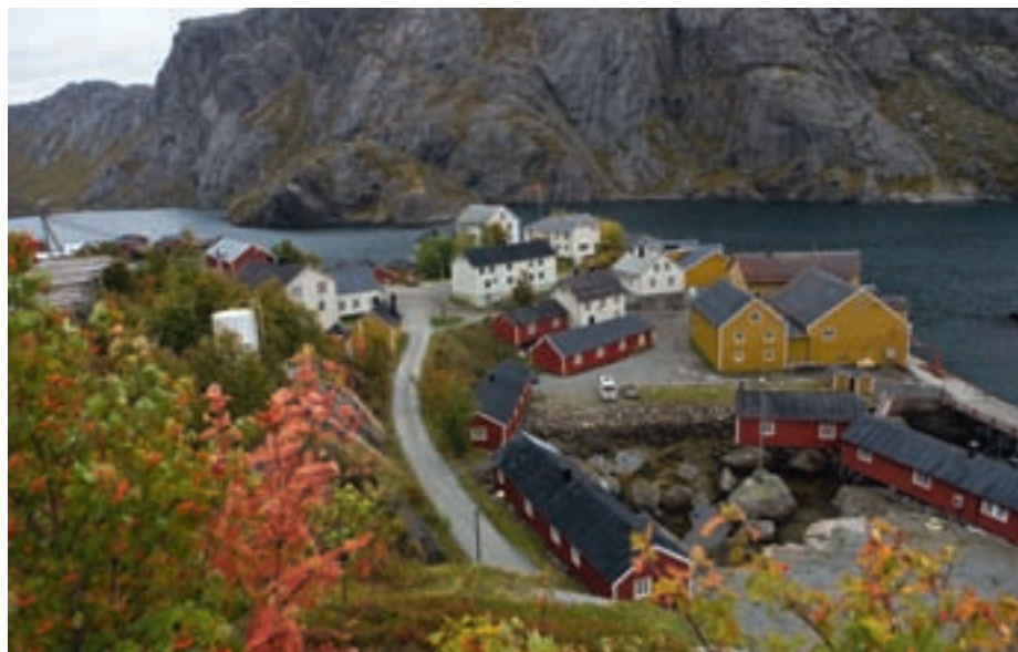
Nusfjord i Lofoten.

rorbuer og en kraftstasjon i Nusfjord (Flakstad kommune). Pilotprosjektet har valgt ut case etter søknad. Styringsgruppen vurderte i starten hvorvidt man skulle velge ut enkelte områder i