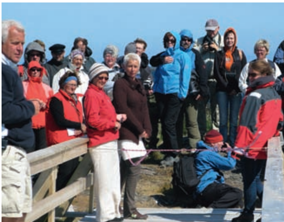
Kulturminnedag og offisiell åpning i Lånan Juli 2009

Tett på i dialog har vært utgangspunktet for de fleste prosesser som er kjørt gjennom pilotprosjektet. Det ble allerede fra forprosjektfasen (januar 2005- oktober2005) etablert et tydelig og forpliktende samarbeid mellom fylkeskommunale avdelinger for næring og samferdsel og kultur og miljø. Det ble ført en systematisk dialog for avklaringer og fellesforståelse for