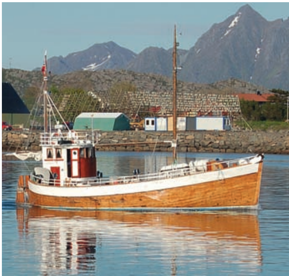
Listerskøyta M/S Symra.

Den verdifulle kystkulturen i Nordland bidro til at LofotenMat ble etablert i januar 2007. Målet med prosjektet, som ble drevet frem av Lofoten Forsøksring, var å etablere et selskap som skal vitalisere tradisjonsmat fra Lofoten slik at den får ny aktualitet og dermed kan gi økt verdiskaping. Lofoten forsøksring ønsket å ta i bruk lokalt produsert råstoff til å lage ferdigvarer basert på tradisjoner og oppskrifter med utgangspunkt i den lokale kulturen. Særlig var det ønske om få frem de landbruksprodukter og fiskeprodukter som gjennom tidene har vist seg ypperlig å frembringe i Lofoten. I tillegg til å etablere selskapet, var det et ønske å sette lokalproduserte råvarer og lokale mattradisjoner i fokus, gjennom å arrangere seminarer og opplæring. I prosessen samarbeidet Lofoten forsøksring med blant annet Arktisk meny, Arktisk landbruk, Tenkeloftet, Innovasjon Norge (på utlands-siden), Norges Råfisklag og Sildesalgslaget. LofotenMat er en paraplyorganisasjon for matprodusenter og brukere i hele regionen. Planene for LofotenMat er å få produsentene til å stå sammen og jobbe målrettet med å sikre kvalitetsprodukter. For å få en større andel av verdiskapingen arbeides det med å øke for-edlingsgraden, dokumentere opprinnelse og sikre høy kvalitet. LofotenMat har gjort en god innsats for å tilrettelegge for, profilere og markedsføre mat fra Lofoten.