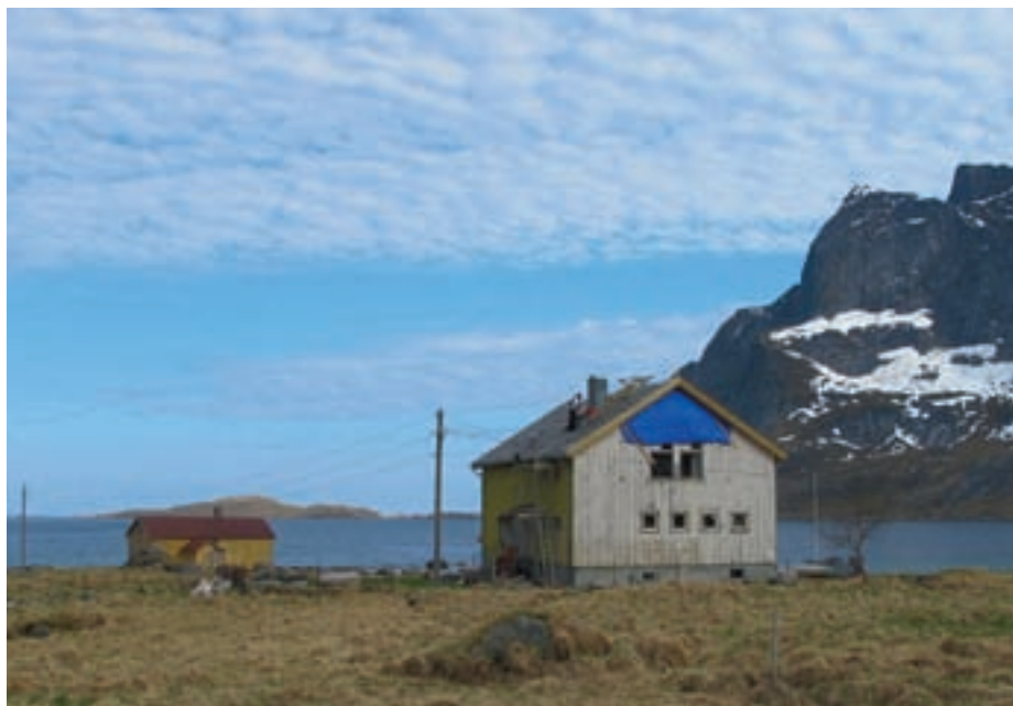
Skolen på Vinstad.

Den immaterielle kulturarven er en viktig del av verdiskapingskjeden. Det er lett å tro at dette har bare sosiale, kulturelle og miljømessige dimensjoner, men vi har erfart at det også kan være basis for økonomisk vekst. I Nusfjord, Henningsvær, Å, Lånan, på Nes og i Nyksund er den immaterielle kulturarven aktivisert gjennom prosjekter som er med på å understøtte