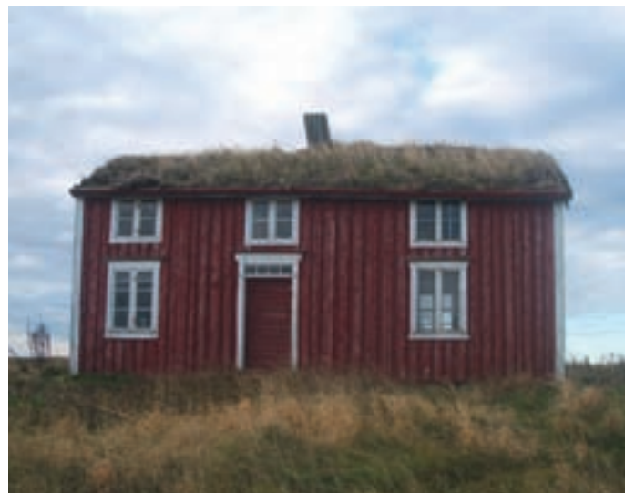
Vega kystgård.