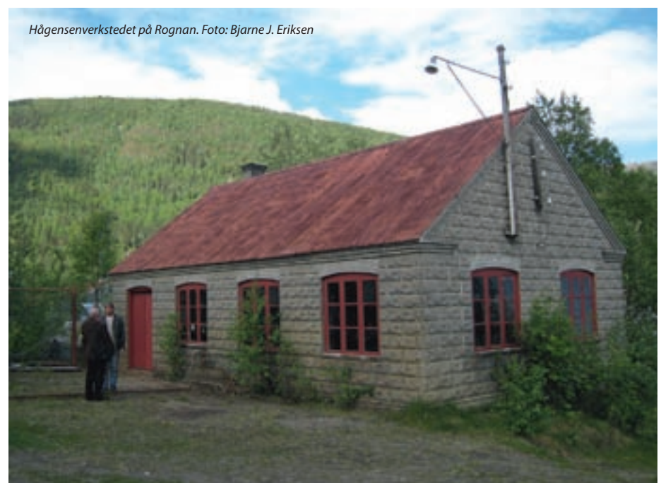
Hågensverkstedet på Rognan.

Et av delmålene med satsingen har vært å samordne virkemidler og avdekke flaskehals for støtte til prosjekter der kulturarven tas aktivt i bruk som ressurs for utvikling. Den verdifulle kystkulturen i Nordland har hatt egne retningslinjer for tilskudd, der fokus har vært å få til både sosial, miljømessig, kulturell og økonomisk verdiskaping. En kunne gi støtte til prosjekter som tok i bruk og vernet om kulturminner, kulturmiljøer eller landskap i nærmiljøet. Det ble lagt særlig vekt på infrastruktur, formidling, identitet, stedsutvikling, byggeskikk, Lofotfisket og ærfugldrift. Dette innebar en nokså bred tilnærming til bruk av midlene, og involverte flere målgrupper enn fylkeskommunen vanligvis henvender seg til. Det ble stilt krav om at prosjektet skulle være fullfinansiert før igangsetting. Norsk Kulturminnefond har gitt støtte til bygningsmessige tiltak og ble en naturlig samarbeidspartner. Innovasjon Norge har ordninger knyttet til det kommersielle aspektet og var også en viktig