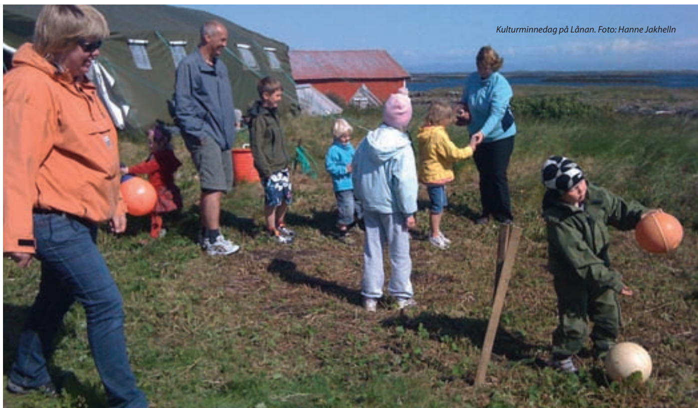
Kulturminnedag på Lånan.

visningsrom, presentasjonsmateriale og videreutvikling av reisetilbudet. En del av prosjektet har gått ut på utvikle diverse dunprodukter, smykker og suvenirer, og nå også en barnebok om E-ungen Eli. Boka skal omhandle livet i et egg- og dunvær på Helgelandskysten og vil videreformidle kulturarven til barn og unge. Bedriften har hatt fokus på formidling helt fra starten og har vært opptatt av å utvikle et helhetlig konsept. De har hatt fokus på posisjonering og markedsføring og har blant annet utviklet en egen webside med nettbutikk. De har vært bevisste på å bruke media aktivt og har blitt omtalt i flere TV- og avisreportasjer i inn- og utland.