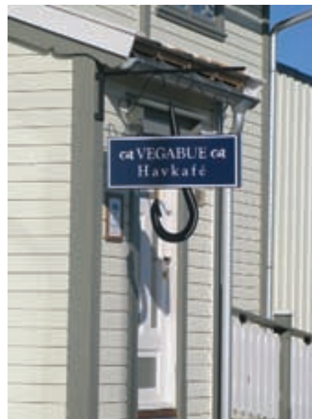
Vegabue havkafé på Vega.

I 2009 vedtok fylkesrådet i Nordland å utvide innsatsområdet i verdiskapingsprogrammet og inviterte kommunene til å sende inn søknader om deltakelse i programmet. Det ble