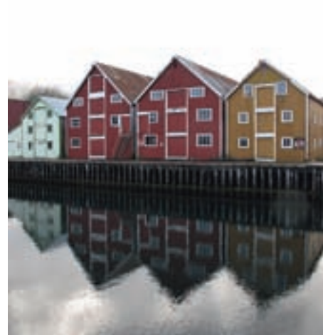
Bryggene i Rognanfjæra.

valgt å legge vekt på større kulturmiljøer i utvelgelsen av nye områder for å kunne se større sammenhenger og kjøre mer tilpassa prosesser. Prosjektet Rognanfjæra i Saltdal kommune ble valgt ut på grunn av sin spesielle kulturarv og bygninger knyttet til båtbyggertradisjonen på Rognan. Området består av mange kulturminner samlet innenfor et relativt lite og avgrensa geografisk område. Det var allerede gjennomført en områdebeskrivelse og kommunen hadde vedtatt at området skulle prioriteres til næringsutvikling med basis i kulturarven. Området er ikke under press for utbygging, blant annet fordi kommunen har tatt et valg om å bevare og utvikle områdets kvaliteter. Dette til tross for at enkelte mener at det beste hadde vært å rive anleggene og heller utvikle det som et attraktivt boligfelt. Kulturminnene omfatter blant annet skipshall, slip, naust, verksted og lagerlokaler. Området består i stor grad av industriminne fra 1800 - tallet og frem til moderne tid. De karakteristiske store trebygningene, Rognanbryggene, inngår i prosjektet. Haagensenverkstedet fra tidlig 1900-tall er det varslet fredningsprosess på. Det gjennomføres nå et dokumentasjons- og formidlingsprosjekt