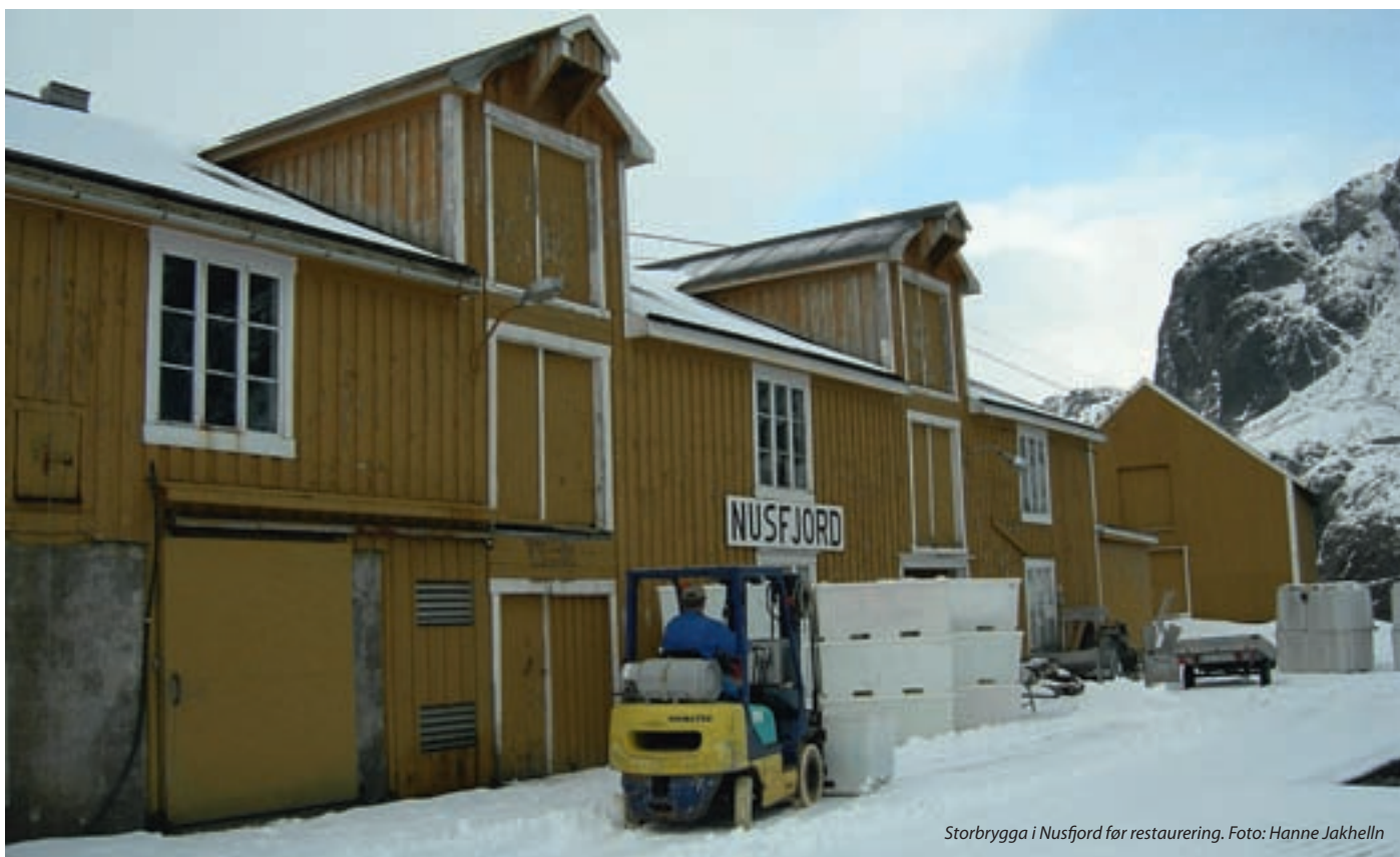
Storbrygga i Nustjord før restaurering.

opp to næringsbygg. Etter at stedutviklingsprosjektet og reguleringsplanen ble vedtatt er det planlagt etablering av tre nye overnattingsbedrifter, samt gjestehavn. Alt dette er private initiativ. Stedet hadde før prosessen startet holdninger som gikk på at kommune hadde ansvar for all utvikling av stedet. Re-