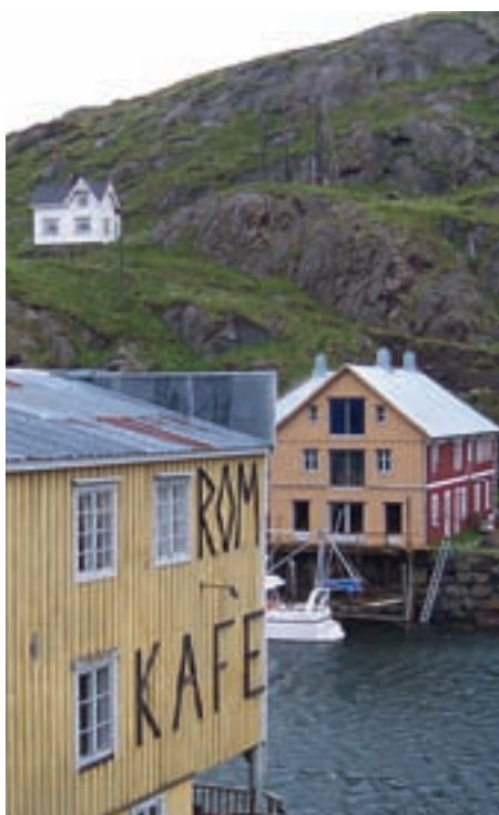
Nyksund i Øksnes

På slutten av 1700-tallet var Kjeøy det viktigste handelsstedet i Lødingen prestegjeld. Handelsstedet eies i dag av private aktører og består av fiskebruk, trandamperi, fyrlykt, oppsynsbolig, fjøs og hovedhus. Store deler av bygningsmassen var satt i stand når prosjektet ble med i verdiskapingsprogrammet, men arbeidet var gjort med en slik kvalitet at antikvariske verdier i stor grad var ivaretatt. Kulturminner i Nordland gjennomførte en befaring for oppstart. Det er utarbeidet en tilstandsrapport med anbefalte strategier videre for ivaretagning av resterende bygningsmasse. I dag er handelsstedet arena for internasjonale forskningsmiljøer innen naturvitenskap og miljø. Eierne har planer om bevaring av alle bygningene på stedet.