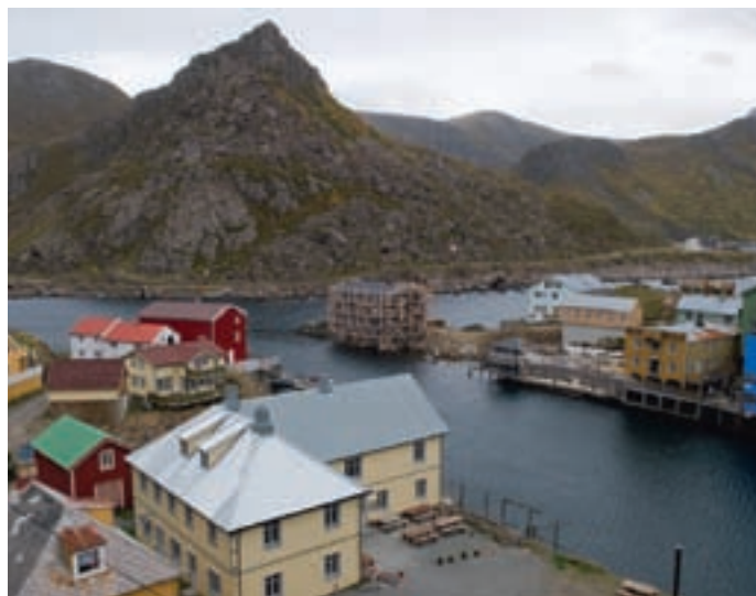
Nyksund i Øksnes.

Vega kystgård skal formidle kulturarven gjennom å ivareta bygninger og vise den spesielle formen for landbruk som ble drevet i disse kystområdene. Vega kystgård skal lage et opplevelsesprodukt gjennom å bruke den intakte bygningsmassen, utstyr, dyr, og den immaterielle dokumentasjonen om gårdsbrukene og om folkene som bodde på Vega og ut i øyan. Konkret vil aktiviteten skje på gårdsbruket på Nes og på husmannsplassen på Emårsøy. Prosjekteierne er bevisste på å utnytte ressursgrunnlaget på gården gjennom hele året. "Grønn omsorg" blir bærebjelken i vinterhalvåret. Om sommeren vil Vega Kystgård kunne tilby besøkende aktiviteter på gården. På Emårsøy kan man få en guidet tur som viser hvordan folk levde på midten av 1800-tallet.