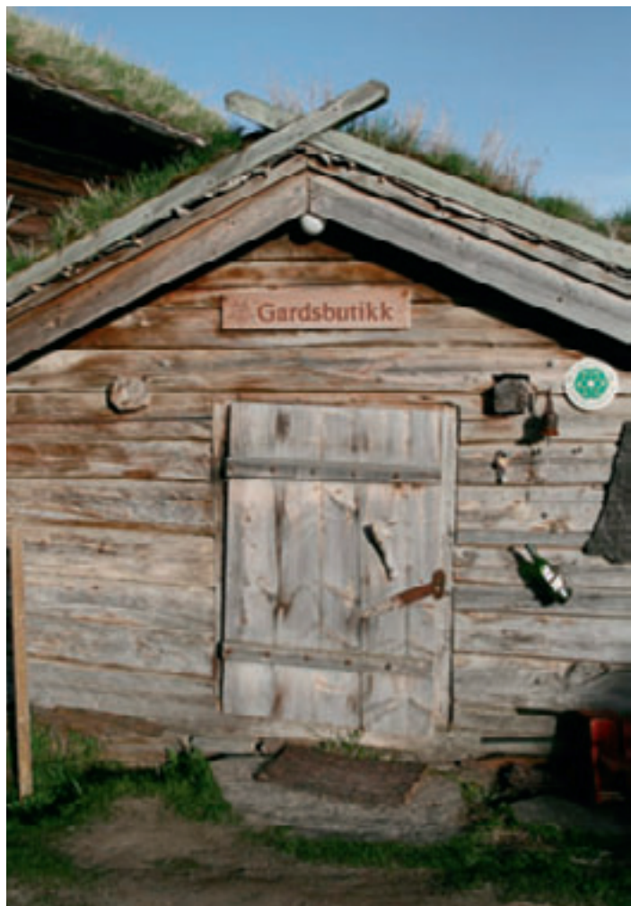
-Valbjør gard, Nordherad i Vågå