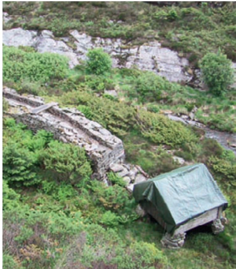
Reparasjon av Selstøbuene og Selstøkverna