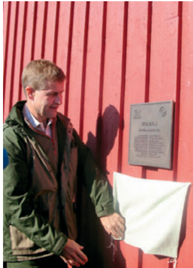
Miljøvernministeren på besøk på Vega