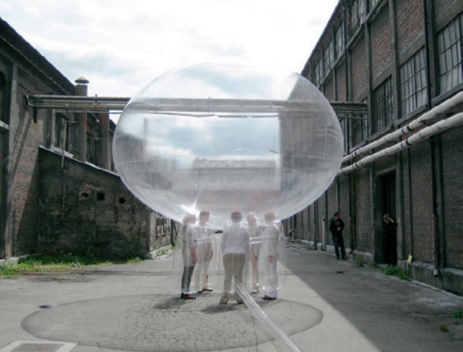
Performance i Odde