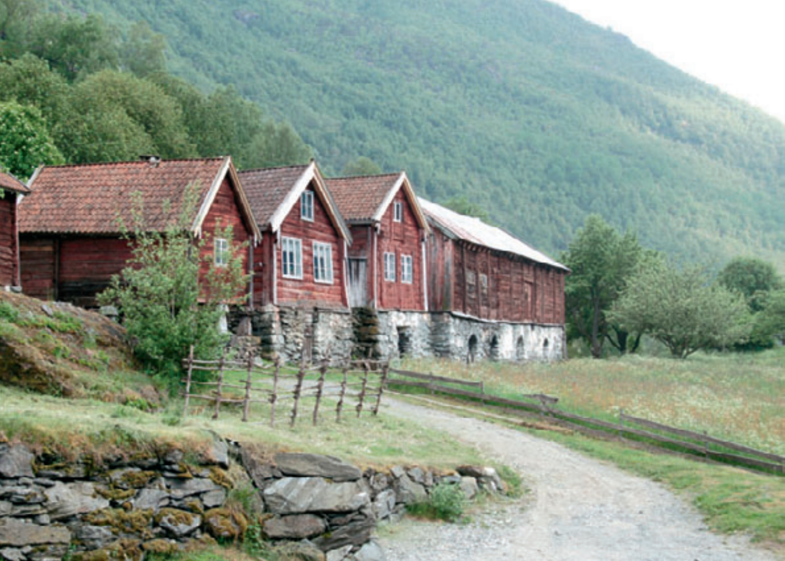
Thomasgarden på Otternes bygdetun