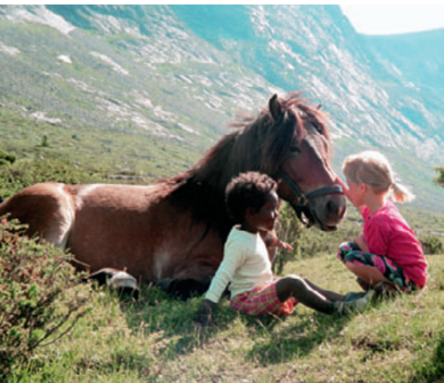
-Velkommen til Sørre Hemsing