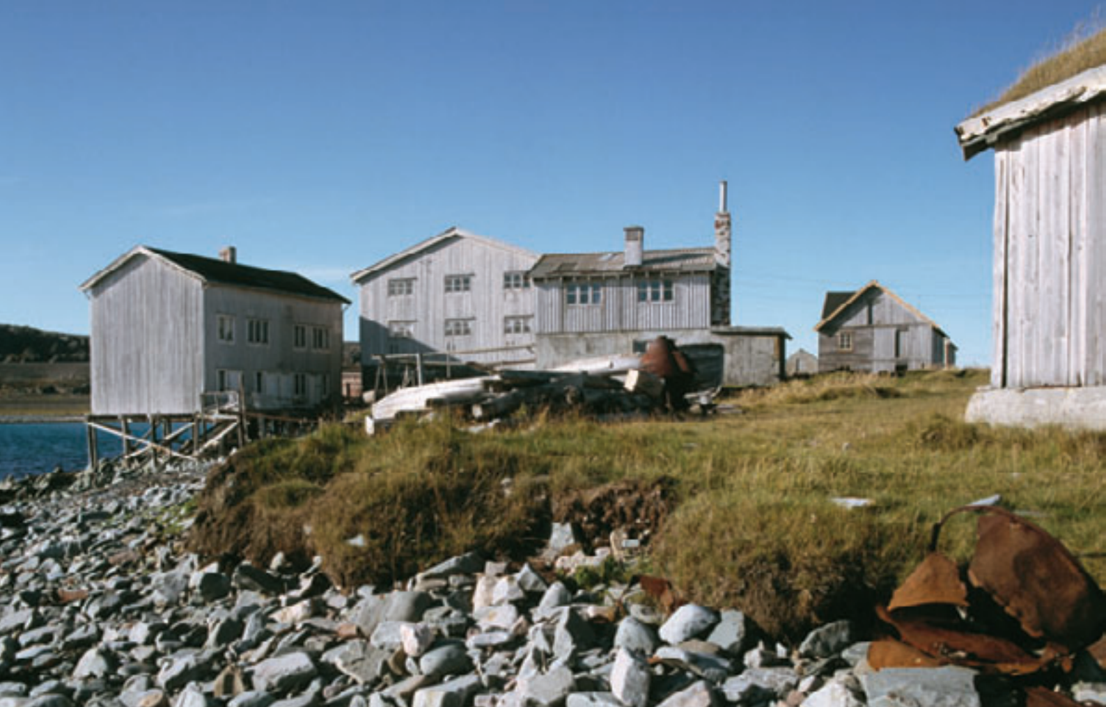
Trebygninger i Hamningberg