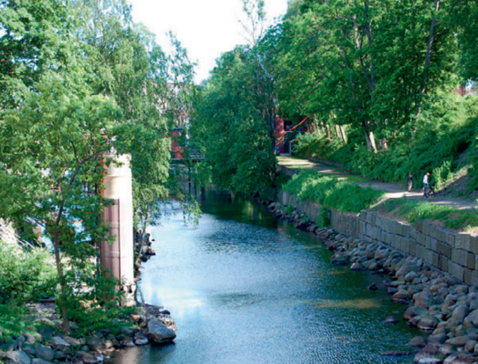
Farriselva Fra åpningen av Sliperiet