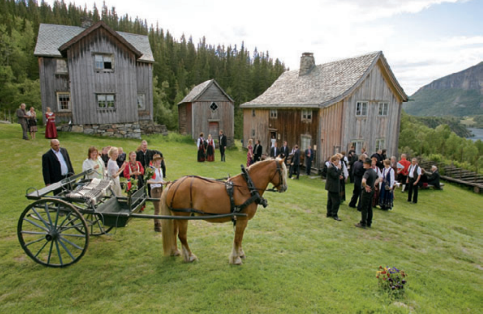
-Gjestebod i tunet på Gamle Kvam