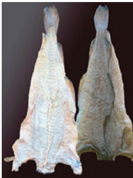
Fra Seløy Fisk AS på Herøy

Det arbeides med opprettelsen av visningscenteret Tørrfiskbutikken i Bergen; Seløy Fisk AS i Nordland har gjennomført utvendig sikring av bygninger og restaureringen av gamlebrygga er avsluttet. H.J.Kyvik AS i Haugesund er i gang med å sette i stand lokalene i "Stålhuset".