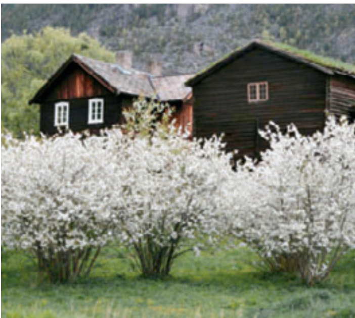
-Synfaring av murt fangstgrav i fjellet