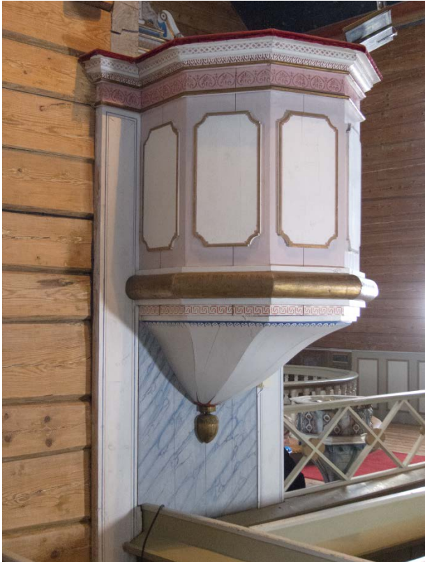
Figur 23: Prekestol mot nord. Tilstand etter behandling.