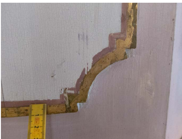
Figur 9: Prekstol mot nord. Dekoren har flere lakuner. Tilstand før behandling.

Det ble retusjert i panelet ved trappeoppgangen, i den nedre delen av prekestolen samt eikenøtten og i den gullfargete nedre profilen. Det ble også retusjert enkelte steder i øvre delen.