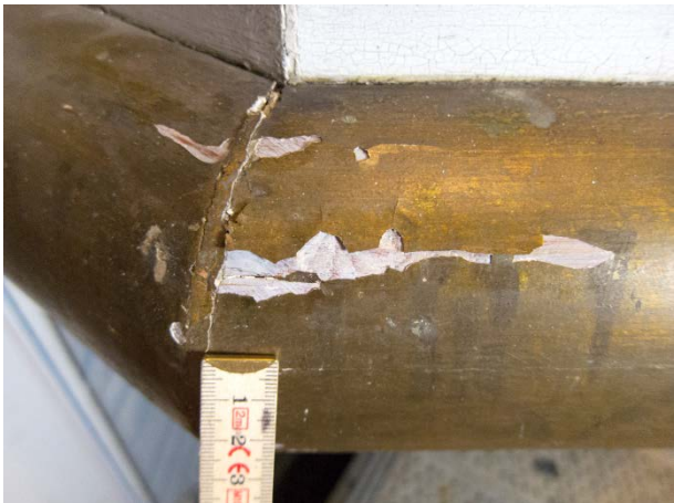
Figur 5: Prekstol mot nordvest. Store opp- og avskallinger i den gullfargete profilen. Tilstand før behandling.

Det var hovedsakelig oppkallinger i den gullfargete nedre profilen, samt enkelte steder på nedre del av prekestolen.