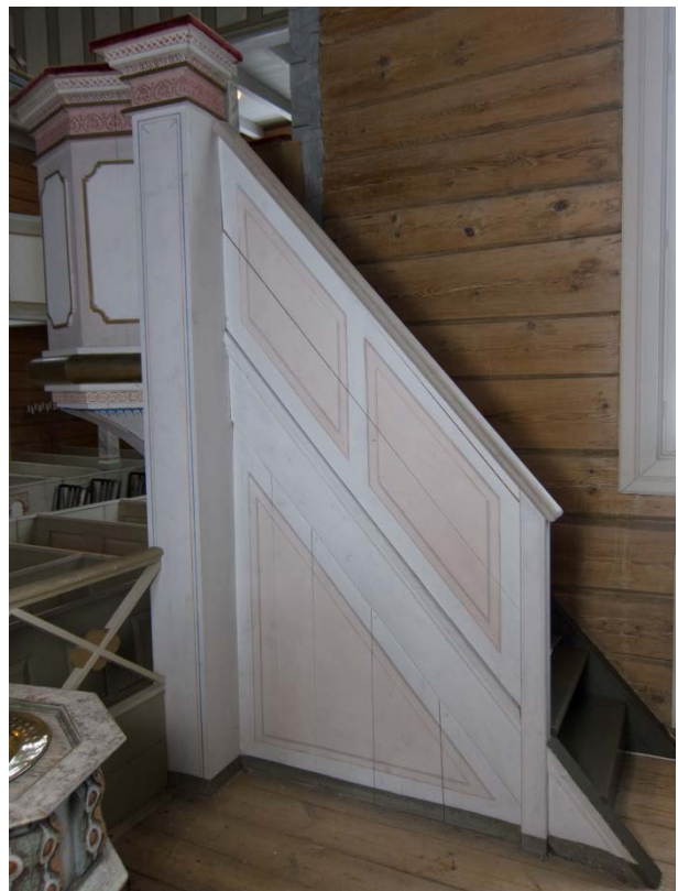
Figur 26: Prekestol med tarpp mot syd. Tilstand etter behandling.