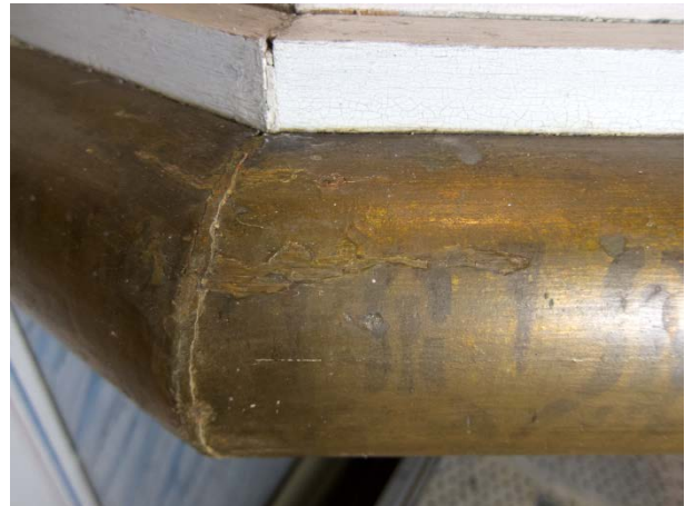
Figur 14: Samme utsnitt som i bildet til venstre. Tilstand etter konsolidering, kitting og retusjering.