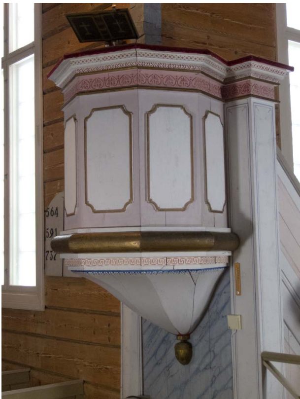
Figur 25: Prekestol mot sydvest. Tilstand etter behandling.