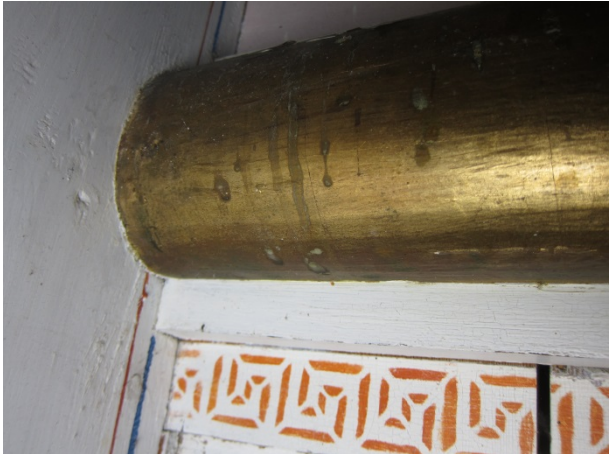
Figur 3: Prekestol mot nord. Rennemerker i den gullfargete profilen.