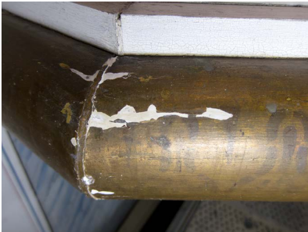
Figur 13: Prekestolen mot nordvest. Samme utsnitt som i Figur 5. Tilstand etter konsolidering og kitting.