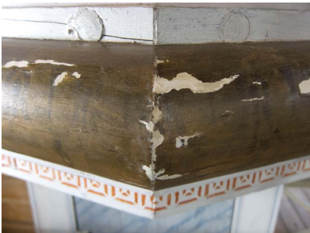
Figur 15: Prekestol mot sydvest. Store lakuner i den gullfargete profilen. Tilstand etter konsolidering og kitting.