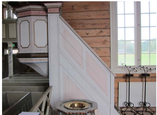
Figur 22: Prekestol med trapp mot syd. Tilstand før behandling.