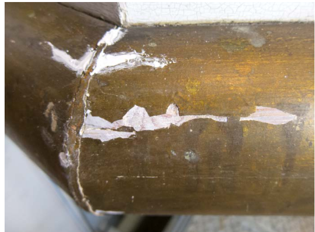
Figur 6: Samme utsnitt som i bildet til venstre. Tilstand etter konsolidering. Den øvre lakunene er under kitting.