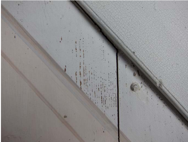
Figur 17: Prekestolens trapp mot syd. Dekoren har flere lakuner. Tilstand før behandling.