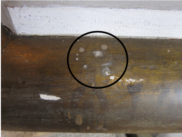
Figur 7: Prekestol mot syd. Markeringen viser voksflekker på den gullfargete profilen. Tilstand før rensing.