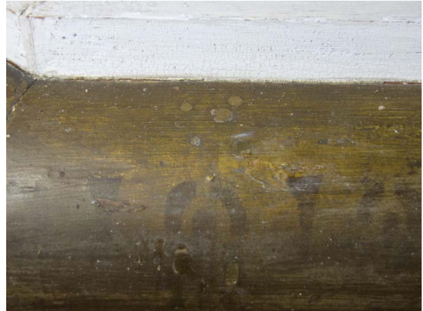
Figur 8: Samme utsnitt som i bildet til venstre. Tilstand etter at voks er fjernet, ovflaten er rensset, og lakuner er retusjert. De gjenstående flekkene er i slagmetallet, og lot seg ikke fjerne.