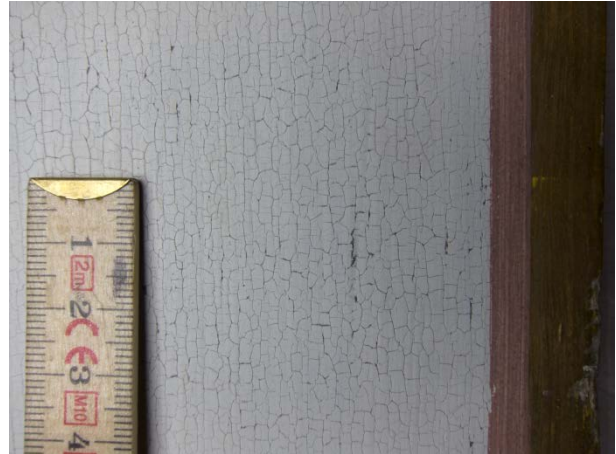
Figur 4: Prekestol mot nord. I områder med hvit maling er det mikrokrakeleringer.