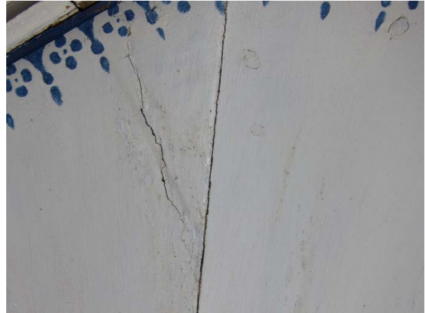
Figur 12: Samme utsnitt som i bildet til venstre. Tilstand etter retusjering. Foto: NIKU/Kaun 2015