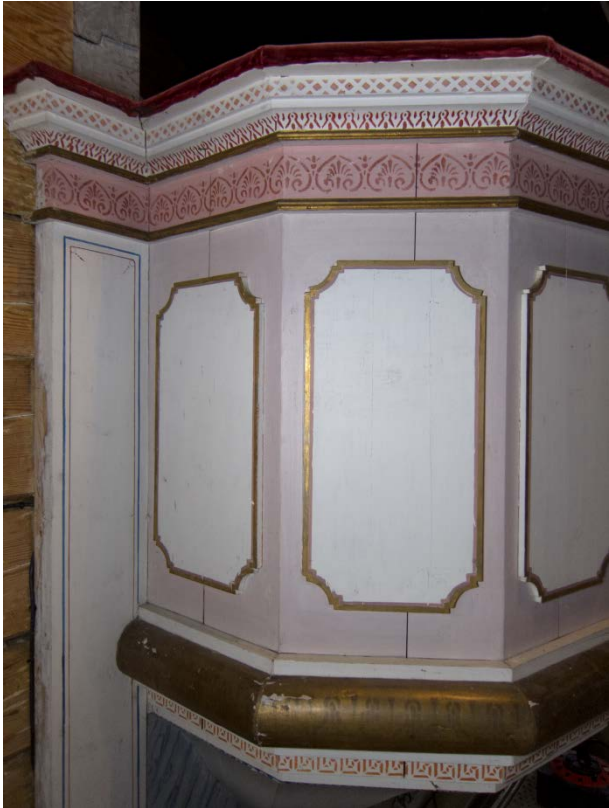
Figur 19: Prekestol mot nord. Tilstand før behandling. Foto: NIKU/Kaun 2015