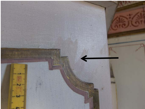
Figur 1: Prekestol, del mot syd. Pilen viser tidligere retusjer, som fremstår som noe mørkere og mattere enn omgivelsene.

Det er uklart om prekestolen tidligere er blitt avdekket 7 , og det er ikke funnet spor etter avdekking. Det finnes flere tidligere retusjer i den hvite bakgrunnsfargen, særlig på undersiden av prekestolen. Retusjene er i dag noe mørkere enn bakgrunnsfargen, og fremstår som skjemmende.