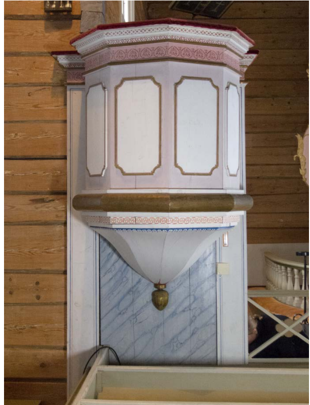
Figur 24: Prekestol mot vest. Tilstand etter behandling.