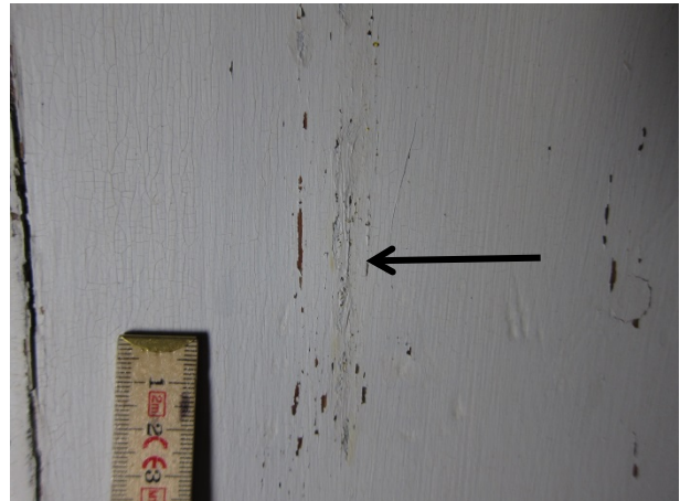
Figur 2: Prekestolens nedre del mot nordvest. Pilen viser tidligere midfargede retusjer.