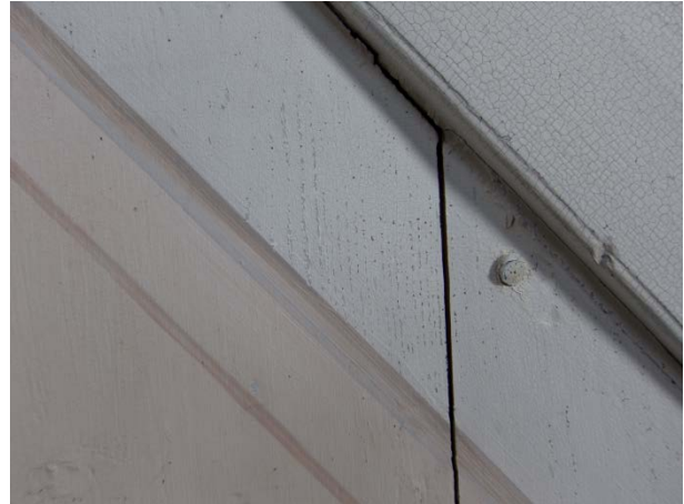
Figur 18: Samme utsnitt som i bildet til venstre. Tilstand etter retusjering.