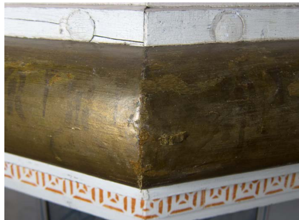
Figur 16: Samme utsnitt som i bildet til venstre. Tilstand etter konsolidering, kitting og retusjering.