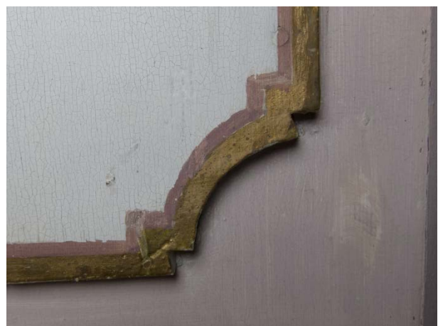
Figur 10: Samme utsnitt som i bildet til venstre. Tilstand etter retusjering.