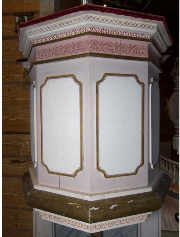
Figur 20: Prekestol mot sydvest. Tilstand før behandling.