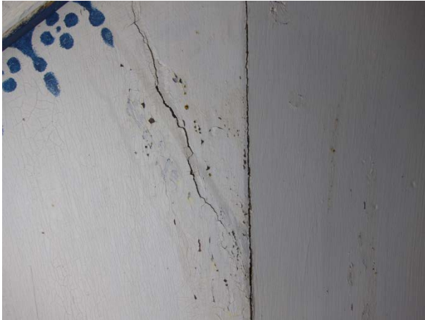
Figur 11: Prekestolens nedre del mot nordvest. Dekoren har flere lakuner og skjemmende tidligere retusjer. Tilstand før behandling. Foto: NIKU/Kaun 2015