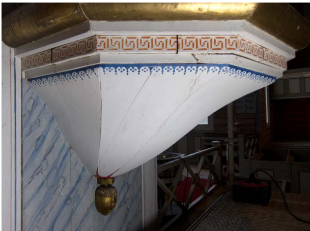
Figur 21: Prekestols nedre del mot nord. Tilstand før behandling.