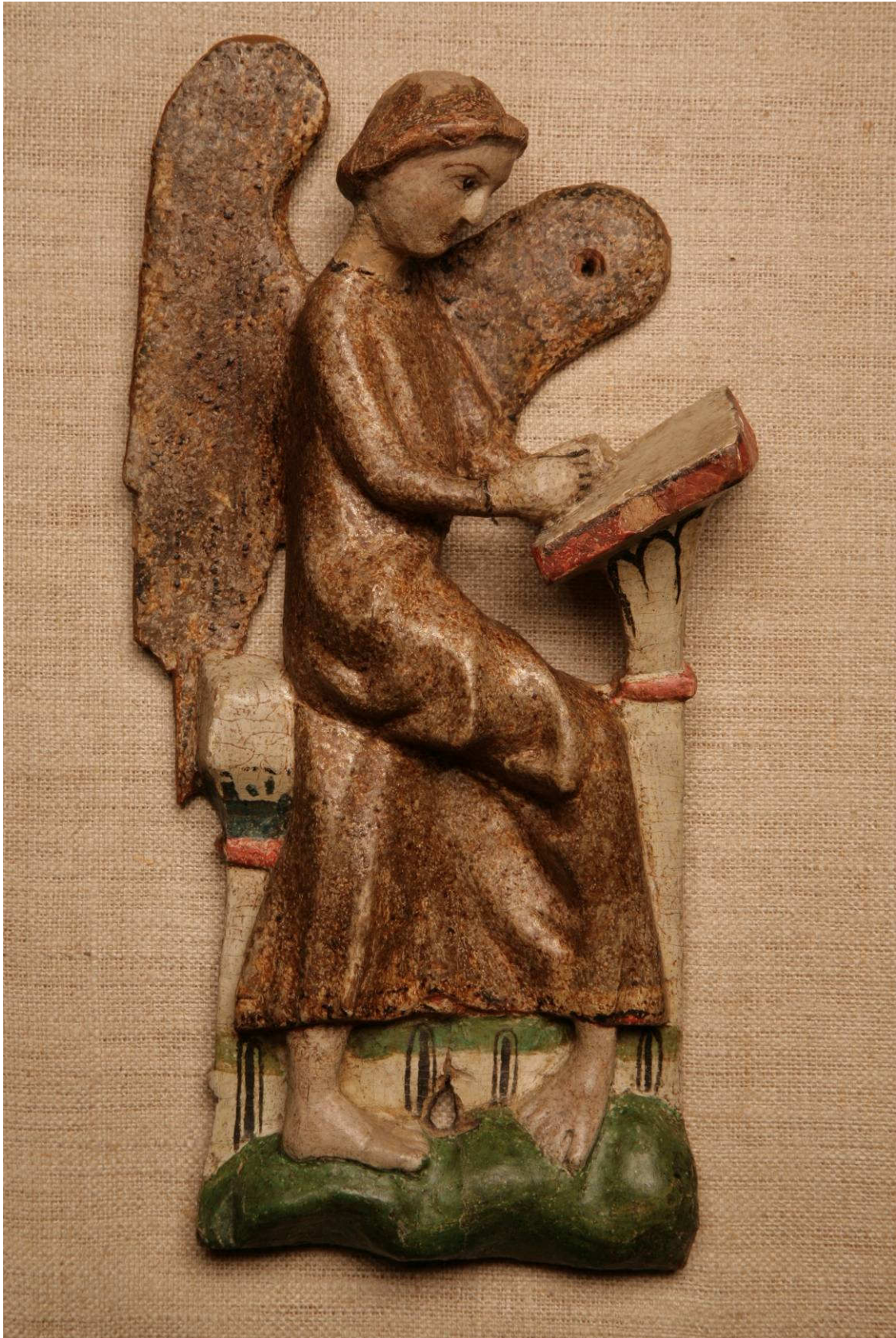
Figur 1. Middelalderrelieffet. Fotografert etter behandling 2007. Hullet i vingen er et moderne skruehull.