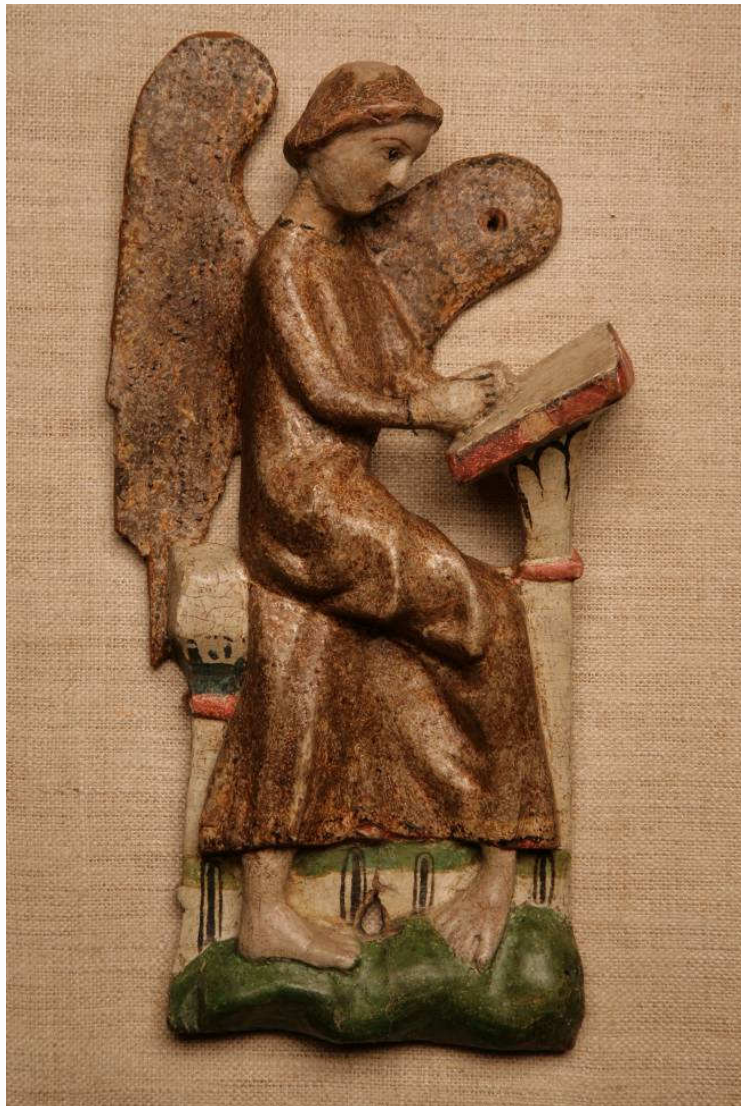
Middelalderrelieffet etter behandling 2007.