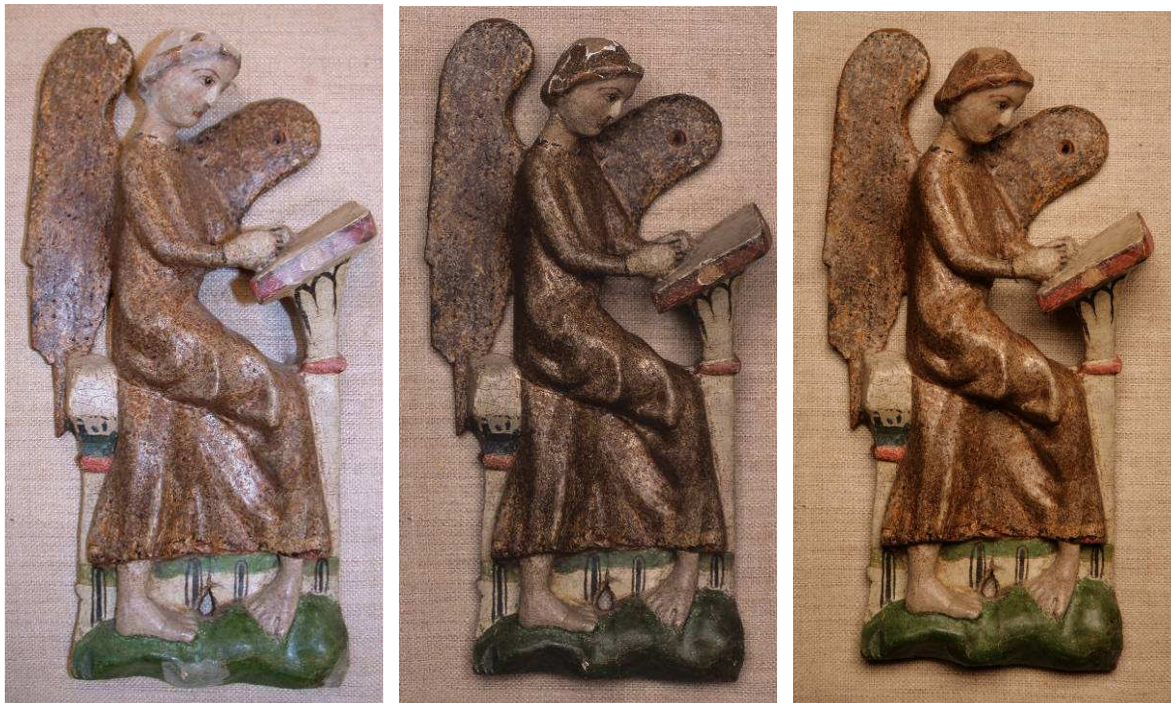
Figur 4. Middelalderrelieffet fotografert før, under og etter behandling 2006 - 2007.