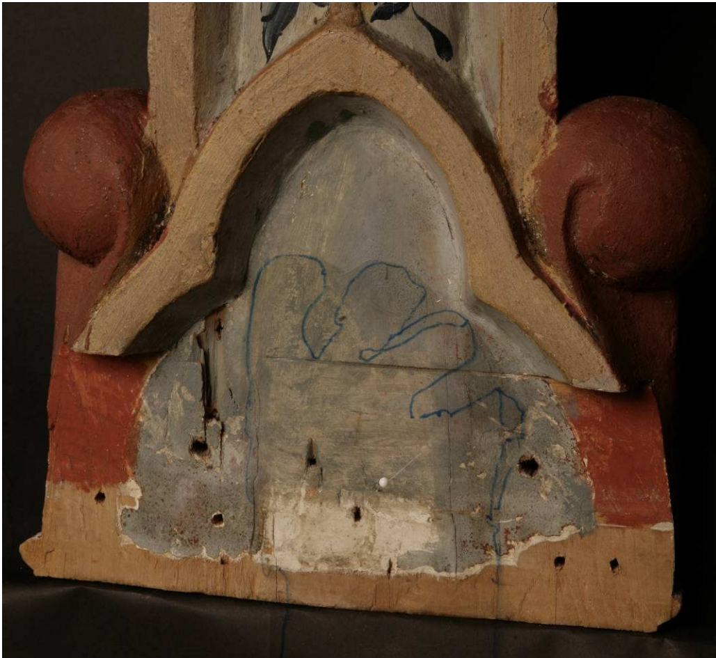
Figur 2. Hedalkrusifikset, detalj nedre trepassfelt på korsstammen, med inntegnet kontur av kirkens middelalderrelieff. Spor av profil viser hvor høyt trepassfeltet opprinnelig var. Det har ikke vært plass til relieffet her.

Men Lange hadde rett i 1958. Det er ikke plass til relieffet i trepassfeltet nederst på korsstammen. Trepassfeltet er for lite, og selv om korsstammen er forhugget nederst, kan man av rester av en profil slutte at trepassfeltet ikke har vært større enn det er i dag (fig.2) Relieffet må ha tilhørt et annet middelalderobjekt, kanskje et annet krusifiks.